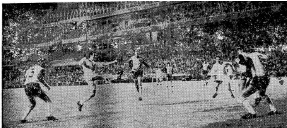
PIRRI MARCA EL QUINTO GOL.—Frente a la meta chipriota, Pirri chuta violentamente y la defensa del Limassol queda virtualmente «congelada». El balón proseguirá su camino hacia el fondo de la malla, decretando la quinta caída del equipo visitante. El Real Madrid estuvo abrumador.