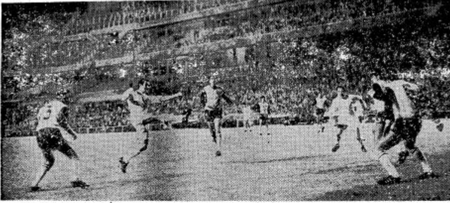
PIRRI MARCA EL QUINTO GOL. —Frente a la meta chipriota, Pirri chuta violentamente y la defensa del Limassol queda virtualmente «congelada». El balón proseguirá su camino hacia el fondo de la malla, decretando la quinta caída del equipo visitante. El Real Madrid estuvo abrumador.