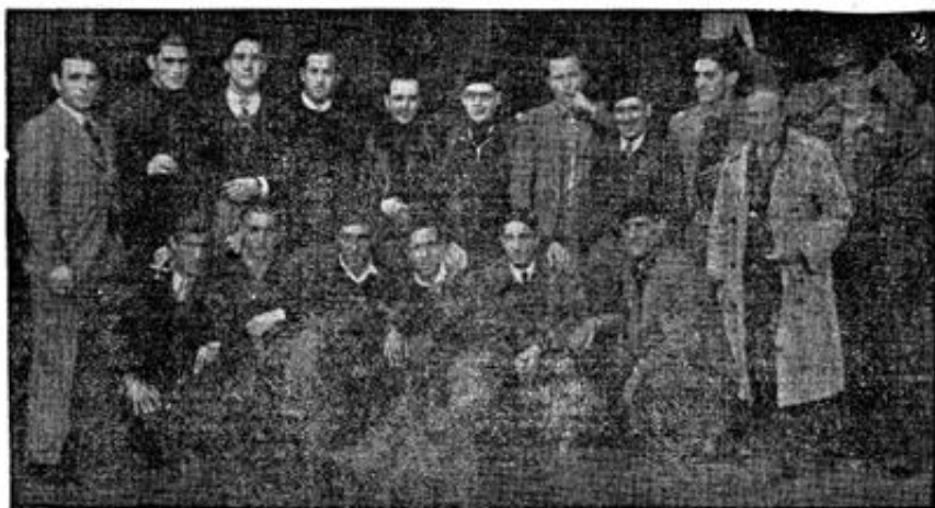
La expedición de los Campeones de Cataluña ayer, en la estación, dispuestos para el primer desplazamiento de Liga

...con el Español a Castellón y el Gerona al campo del Gimnástico valenciano