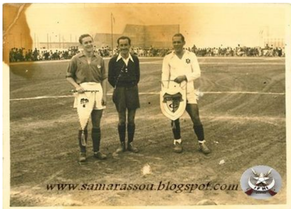
Figura 6. Entrega de Banderines.

La búsqueda en internet nos ha permitido recuperar la fotografía que aparece en el seminario A.O.E. del 25 de julio del intercambio de banderines con una calidad muy superior (figura 6) 6 . Vemos a los tres protagonistas (Molowny, Saldías y Barber) en el centro del campo después del protocolario intercambio de banderines. Barber porta un banderín con el escudo del Marino F. C., mientras Molowny sujeta un banderín triangular blanco con el de la selección de fútbol de Ifni (Figura 7) 7 . En la camiseta del capitán ifneño podemos apreciar un escudo que intuimos es el escudo nacional del momento, con el águila de San Juan, sin que podamos apreciar si incluye alguna referencia al territorio o aparecen los cuarteles históricos de Castilla, León, Aragón y Navarra.