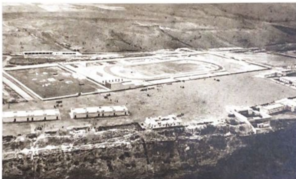
36 - SIDI IFNI