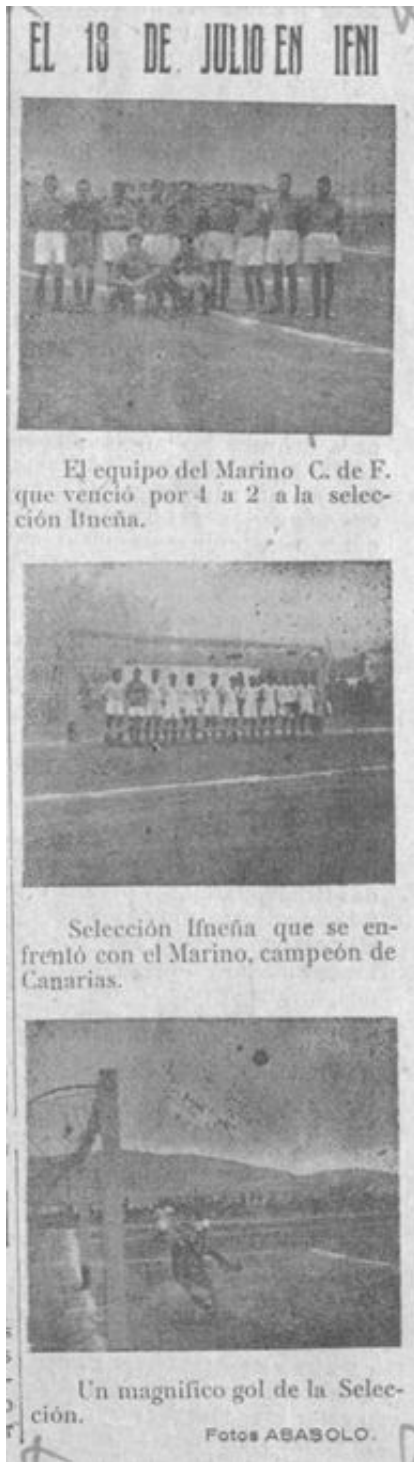
Figura 3. “El 18 de Julio en Ifni” (fotos Abásolo), A.O.E., n. 63, 18 de agosto de 1946. En: https://jable.ulpgc.es/viewer.vm?id=670&page=3 . Recuperado en septiembre de 2022