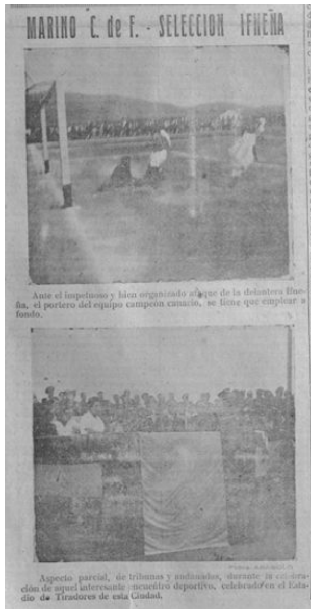
Figura 5. “Marino C. de F. – Selección de Ifni” (fotos Abásolo), A.O.E., n. 68, 22 de septiembre de 1946. En: https://jable.ulpgc.es/viewer.vm?id=685 . Recuperado en septiembre de 2022.

A modo de anécdota y en contraste con la lógica y amplia repercusión del encuentro en la prensa local de Ifni presentamos su mínima presencia en el diario Falange de Las Palmas del 19 de julio de 1946. Un reducidísimo texto de apenas 11 líneas bajo el título “4-2 El Marino venció EN IFNI”, en el que, además, se confundela selección de fútbol de Ifni con el Club Deportivo Ifni: