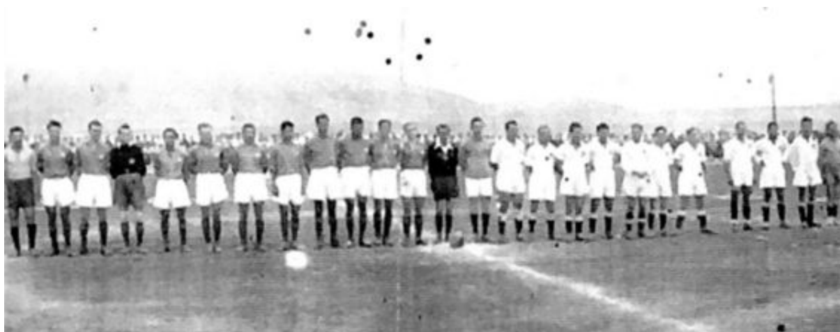
Figura 2. El árbitro y los equipos del Marino C. F. y la selección de Ifni alineados en el centro del campo (DOMINGUEZ GARCÍA, Jesús (2013), tomo III, p. 137)

Nuevamente, el 28 de julio el partido vuelve a aparecer en las páginas del semanario. En este caso dentro de un artículo que nada tiene que ver con el deporte. Se titula “La Fiesta de Exaltación del Trabajo en Ifni” y trata sobre el día de convivencia entre patronos y productores. No falta nada, concentración sindical, entrega de la bandera al Grupo de Tiradores, desfile de las tropas, comida de hermandad, discursos de las autoridades, partido de fútbol, sesión de cine y verbena popular. Sobre el partido nos cuenta lo siguiente: