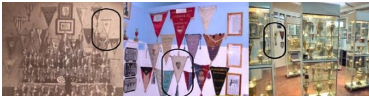
Figura 7. Tres fotografías donde aparece el banderín que la selección de Ifni entregó al Marino C. F. Fechadas, de izquierda a derecha, en 1951, 2011 y 2018.

Entre la amplísima bibliografía sobre el territorio de Ifni hemos encontrado una referencia sobre este partido en el libro autobiográfico de Alfredo Robles, editado en 2006. En él describe punto por punto las noticias aparecidas en el semanario. Primero el rumor sobre la llegada de un equipo canario de fútbol para jugar en Ifni y la alegría al confirmarse la noticia: