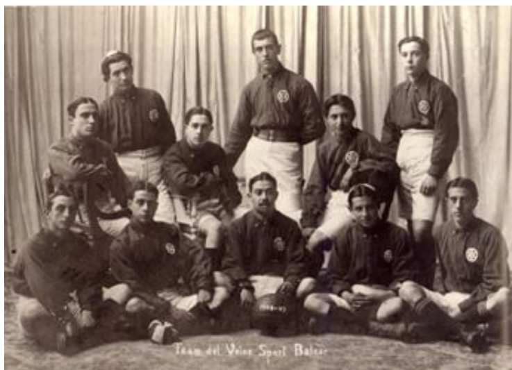
Sección de fútbol del Veloz Sport Balear (Los Deportes, 28 de febrero de 1909)