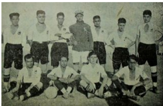
Formación del Constancia (Sport Balear, 15 de noviembre de 1924)

Para la segunda temporada oficial, la 1924-25, el Comité Provincial Balear amplió la competición en Mallorca de 4 a 21 equipos, distribuidos en primera categoría (grupo único) y segunda categoría (tres grupos de ámbito geográfico). Además, la primera categoría, que había perdido a uno de sus integrantes originales (la UPM había desaparecido) se amplió a cinco equipos con la incorporación de dos nuevos integrantes: el FC Manacor... y el Constancia, que ingresaron directamente, sin disputarse promoción alguna. En este hecho parece claro que el Comité quiso convertir la primera categoría en una competición de carácter insular incorporando dos equipos de la Part Forana de Mallorca, para fortalecer la propagación del fútbol por toda la isla y fomentar rivalidades interregionales al más alto nivel, más allá de la capital palmesana.