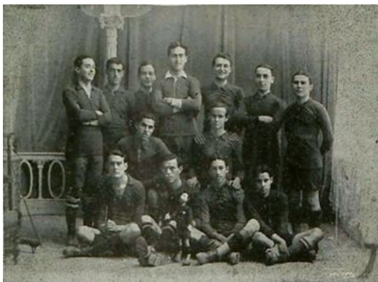
Real Sociedad Alfonso XIII FC (Baleares, 7 de abril de 1917)

Todo ello hizo que el fútbol balear, en comparación con el del resto del Estado, arrastrase cierto retraso estructural que le hizo despegar con unos veinte años de retraso. Así, la primera sociedad futbolística estable no se creó hasta 1916: la Real Sociedad Alfonso XIII FC (actual Real Club Deportivo Mallorca), en un momento en el que ya había diversos campeonatos territoriales organizados por las respectivas federaciones territoriales en España. Y su fundación tampoco supuso un empuje decisivo, dado que la competición federada no llegaría hasta 1923.