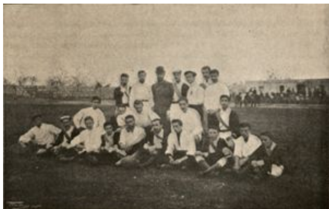
Club España (Palma) y Club Barcelonés (Los Deportes, 18 de enero de 1903)

Los primeros equipos organizados en Mallorca se remontan a finales de 1902. Nace entonces el Club España , equipo vinculado al Círculo Ciclista , y a mediados de 1903 el Veloz Sport Balear , ligado a la entidad homónima. Ambos nacen como secciones vinculadas a entidades ciclistas, entonces el principal deporte de la isla, y el segundo llegaría a ser el más potente de aquellos años. [2]