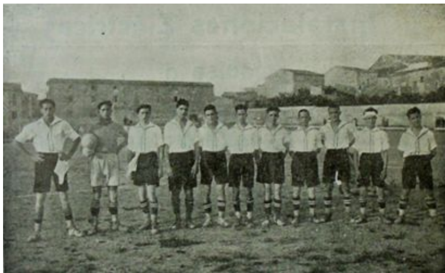
Formación del Constancia (Sport Balear, 15 de agosto de 1925)

En temporadas posteriores su potencial se fue incrementando, convirtiéndose en un habitual de la primera categoría del campeonato de Mallorca y gradualmente se coló en los primeros puestos hasta presentar su candidatura al triunfo final, como así sería pocos años después.