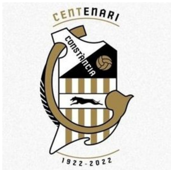
Logo conmemorativo del centenario del Club Esportiu Constància