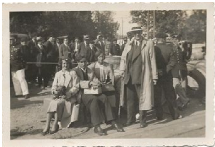
Desembarco en Le Havre, Francia