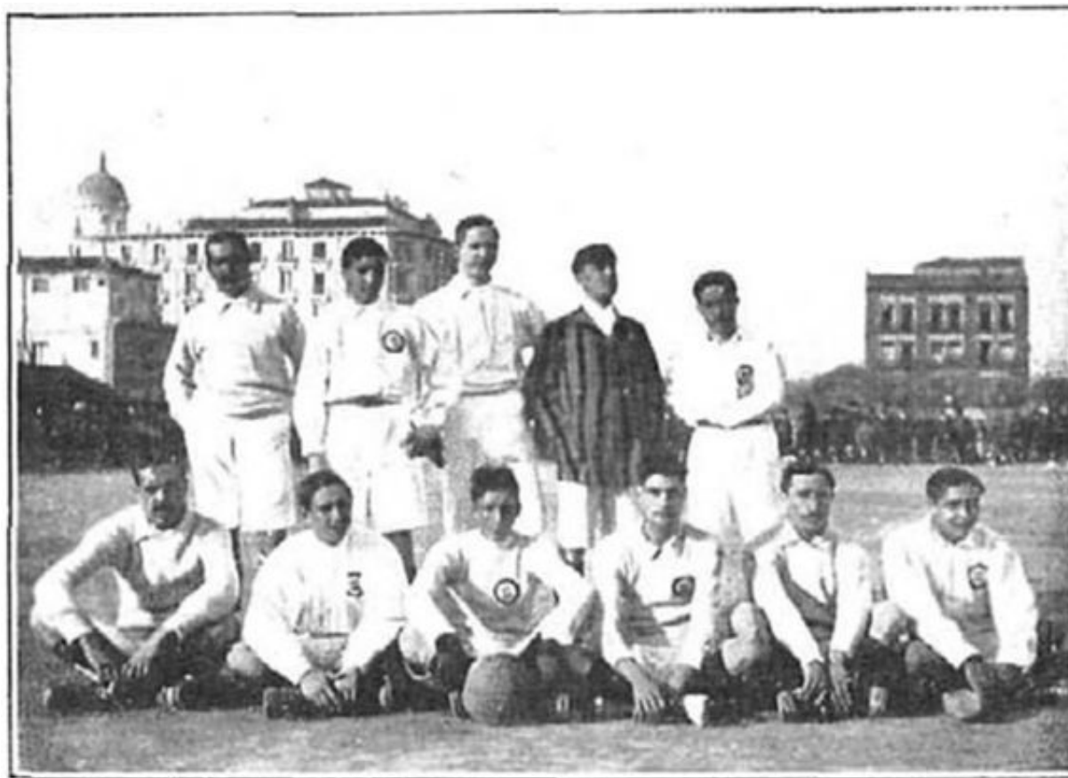
Equipo del "Madrid F. C."

La primera imagen del ariete de la que he podido tener constancia, corresponde al once del Madrid F.C. antes de disputar su partido del Campeonato de Madrid ante el Athletic Club de Madrid, vencedor del duelo por 0-2 el 30 de enero de 1909. La fotografía sale publicada en el periódico madrileño Gran Vida el 1 de febrero y Didixein es el más alto de todos los que posan de pie, en el centro de la instantánea.