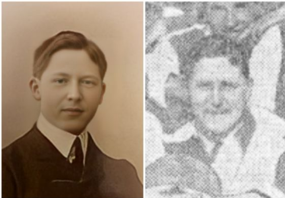
Foto Comparativa Didisheim