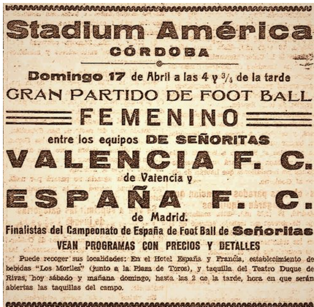
Figura 1. El anuncio del partido de football entre el Valencia F.C. y el España F.C. apareció publicado en La Voz los días 16 y 17 de abril de 1932.

Haciendo un pequeño inciso, el coliseo cordobés, inaugurado durante la Feria de Mayo de 1923, había vivido ya los célebres y reñidísimos partidos de rivalidad local entre el Córdoba Sporting Club y la Sociedad Deportiva Electromecánica F.C. de los años veinte, y atravesaba ahora por una nueva época protagonizada por su nuevo inquilino, el Córdoba Racing Club, origen de la indumentaria blanquiverde que con los años heredaría el actual Córdoba Club de Fútbol.