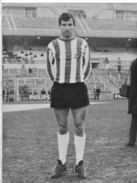
Campo del Santiago Bernabeu. 1967

Conjuntos del momento como el Granada, Valladolid, Betis, Las Palmas, Murcia, Real Oviedo, Málaga, Hércules, Elche, Sabadell, Rayo Vallecano, Levante, Mestalla, Mallorca, Recreativo de Huelva, Cádiz, Tenerife, etc. vieron perforada la red de potente disparo por un joven casi desconocido hasta entonces. Entre sus características, a parte del disparo, figuraban las del juego aéreo, la velocidad en carrera y una enorme intuición que nunca puede faltar a un buen estilete. Ciertamente resultaba un tanto anárquico en su situación táctica, pero se le perdonaba cada vez que uno de sus potentes disparos levantaba al público en las gradas.