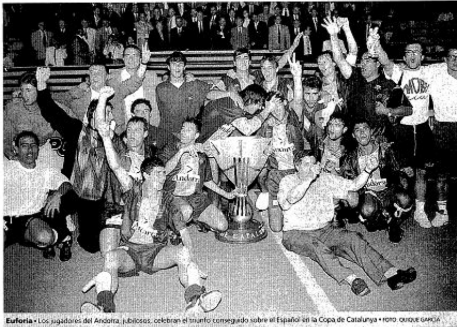
Euforia. Los jugadores del Andorra, jubilosos, celebran el triunfo conseguido sobre el Español en la Copa de Catalunya.

El Español no puede marcar y la Copa de Catalunya se decide en los penaltis (2-4)