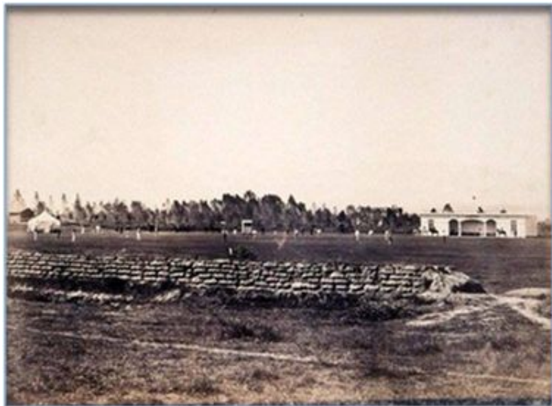
Club Reforma en Paseo de la Reforma 1897

El Club, compuesto por parte de la alta sociedad de la capital, tanto mexicanos como ingleses y estadounidense, tuvo una verbena deportiva el día de su inauguración[5].