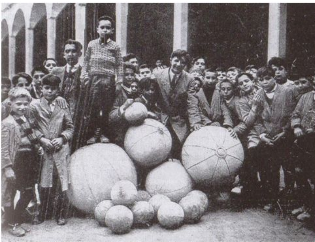
Los famosos balones del Colegio de Orduña (c. 1920). Llama la atención «el pelotón, pesado y colosal, de cuero cortado en segmentos, semejante a un mundo con meridianos y polos», en expresión de Daniel Lecanda.

Es razonable pensar que algo similar ocurriría en los colegios de Barcelona, en los colegios religiosos y burgueses de Barcelona. Sin duda se jugaba a “ foot-ball ”, en el marco de una educación pretendidamente regeneradora, moderna y “europea”. Lo jugaban niños, evidentemente, pero no se les enseñaba a jugar a fútbol, ni se les instruía para ser más eficientes, simplemente jugaban. No se pensaba en el futuro, ni en su progresión como “ foot-ballistas ”. Tan sólo se contaban los jugadores de cada bando, se determinaba dónde estaban y cómo eran de grandes las porterías, se dejaba caer un pelotón -pelota de diversos tamaños, como ilustra la fotografía del libro de (Turuzeta, 2012)-, en medio de ambos bandos y... a jugar ¡!!.