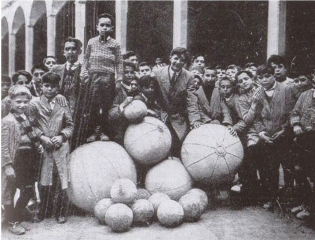
Los famosos balones del Colegio de Orduña (c. 1920). Llama la atención «el pelotón, pesado y colosal, de cuero cortado en segmentos, semejante a un mundo con meridianos y polos», en expresión de Daniel Lecanda.