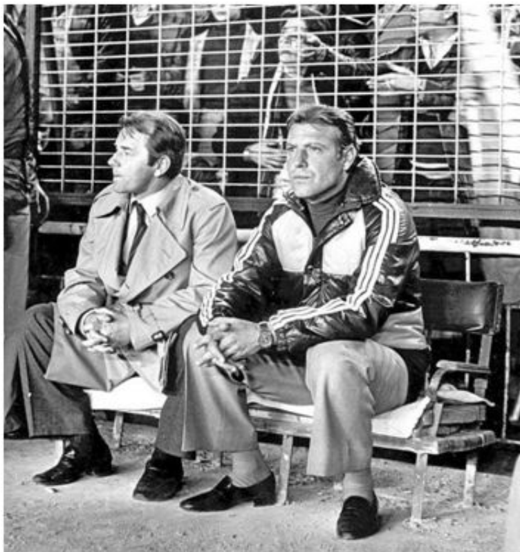
Boskov y Grosso en el banquillo del Bernabéu en la temporada 81-82

Tras la retirada, y pese a que Grosso había declarado un par de años antes que no quería seguir ligado al fútbol y menos de entrenador profesional, se desdijo de aquellas palabras para comenzar poco después a entrenar al Magerit juvenil. No pasó mucho tiempo y retornó a la “Casa Blanca”, primero como coordinador de equipos en la cantera madridista, aunque también le usaban como observador por lo que Raimundo Saporta, en el verano de la muerte de Bernabéu, le mandó a ver jugadores en una gira por Sudamérica. En 1979 ascendería a entrenar a los Juveniles, para en 1981 dar el salto y pasar a ser ayudante de Vujadin Boskov en la última temporada de éste como entrenador de la primera plantilla. Con la incorporación de Amancio como entrenador del Castilla, pasó a ser su segundo y tras promocionar éste al primer equipo, continuó como ayudante suyo. Desde ese momento sería de manera habitual el 2º entrenador del primer equipo con Amancio, Luis Molowny, Leo Beenhakker, John Toshack, la dupla Di Stefano/Camacho y Radomir Antic. Entre tantas temporadas también hubo un paréntesis para entrenar al Castilla, junto a García Remón al no tener éste el carnet de entrenador nacional, durante gran parte de la temporada 86-87.