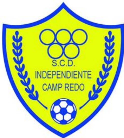
Escudo actual de la SCD Independiente

La Sociedad Cultural y Deportiva Independiente (en catalán, Societat Cultural i Esportiva Independent ) del barrio de Camp Redó (Palma, Mallorca), popularmente conocida como el Inde , es uno de los clubes más veteranos de la capital balear, solo por detrás de los dos grandes colosos de la ciudad: el RCD Mallorca (1916) y el Atlètic Balears (1920), situados a otro nivel social, deportivo e histórico. Después de la desaparición del tercer histórico en disputa, el CD Soledad (1930-2010), la brecha entre los grandes clubes y el resto se ha agrandado más si cabe,