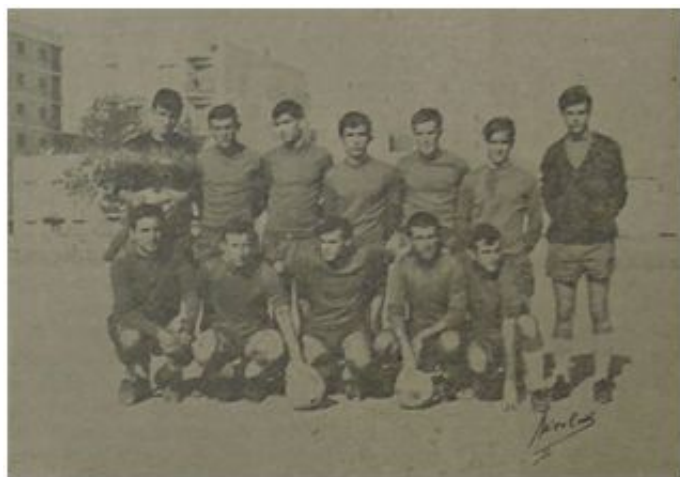
Primer equipo de la SCD Independiente, 1967

hasta el punto que no es hasta los años 60 que encontramos a otros clubes consolidados en la ciudad, aunque fundados a nivel de barrio y de pretensiones más modestas, pero que han ayudado a configurar el panorama futbolístico de la ciudad a pie de calle, más allá de la casi centenaria rivalidad entre Balearicos y Mallorquinistas. El Inde es uno de ellos, y sin duda uno de los más importantes.