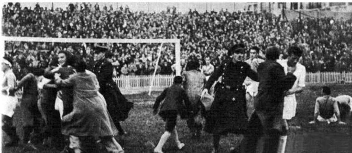
Acabado el encuentro muchos aficionados invadieron el campo.

La excitación ante lo presenciado hizo que muchos aficionados invadiesen el terreno de juego para agasajar a los protagonistas, motivando la intervención de las fuerzas del orden.