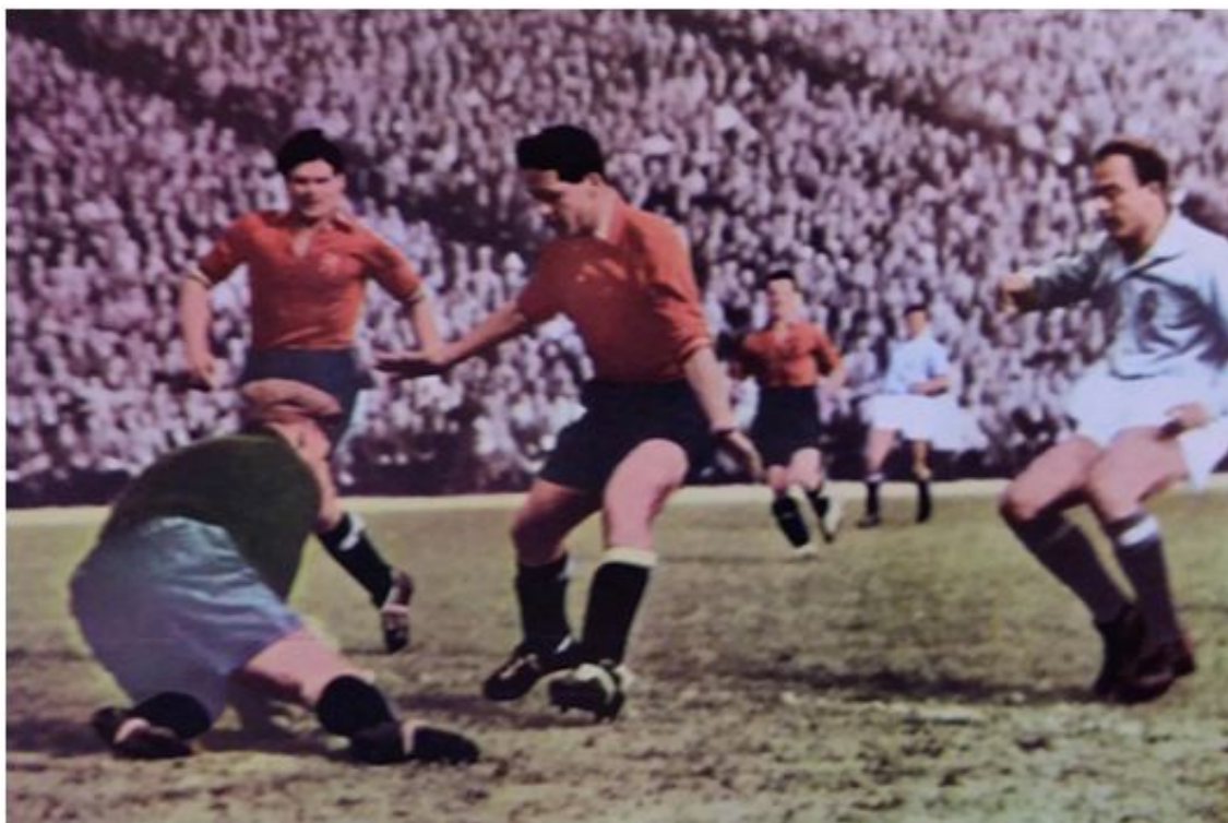
Di Stéfano, a la derecha, en un lance del partido de Heysel.