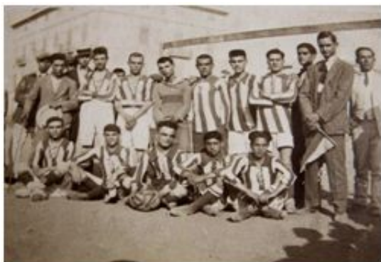
Fotografía del equipo más antiguo del Baleares FC que se conoce, 17 de junio de 1921

En poco tiempo el club vivió un crecimiento fulgurante. Aglutinó a una extensa masa social de clase social media-baja, de acuerdo con los orígenes obreros de sus primeros practicantes, y forjó un potencial deportivo considerable que le llevó a convertirse en principal alternativa al otro gran club palmesano, la RS Alfonso XIII. De hecho, a mediados de 1921 los enfrentamientos entre ambos equipos ya despertaban gran expectación entre los aficionados, además de altercados y encendidas disputas tanto verbales como físicas que trascendían el ámbito estrictamente deportivo. Fruto de este crecimiento el club construyó un nuevo campo en la barriada palmesana de Son Canals gracias a las aportaciones de sus socios. Fue inaugurado el 24 de julio de 1924, aunque ya estaba en uso desde principios de 1923.