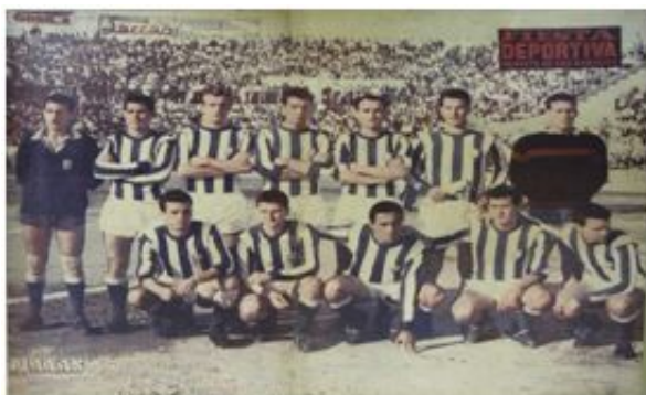
Formación del CD Atlético Baleares (Fiesta Deportiva, 17 de junio de 1961)

A pesar de no lograrse el ascenso el club seguía creciendo y el viejo campo de Son Canals , inaugurado en 1923, se había quedado pequeño. Así que se impulsó la construcción de un nuevo campo: el Estadio Balear, impulsado por una cooperativa de pequeños propietarios (Procampo) la cual fue titular de los nuevos terrenos. El nuevo campo fue inaugurado el 8 de mayo de 1960 con un partido contra un potente rival: el Birmingham City FC , subcampeón de la antigua Copa de Ferias en 1960 y 1961. El conjunto balearico ganó por 2-0.