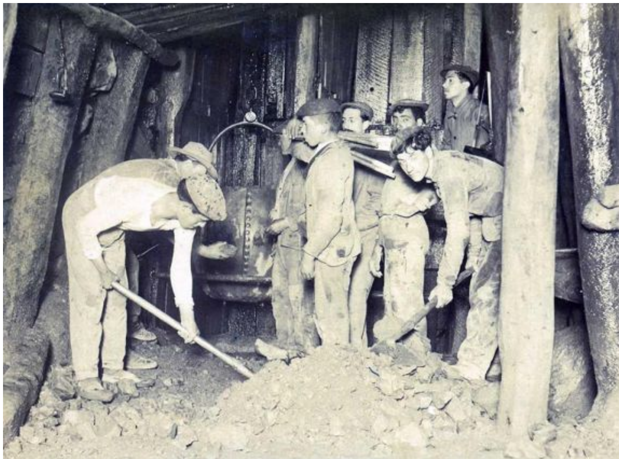
La subsistencia de muchas familias obligaba al trabajo de sus miembros más jóvenes. Guajes en una galería de Mina Peña (The Oviedo Mercury Mines Ltd.), Mieres, 1910.

Una circunstancia coyuntural vendría a impulsar de manera definitiva el fomento del sport entre las clases populares. La Ley del descanso dominical, aprobada por el Congreso de los Diputados el 3 de marzo de 1904, proporcionaría un tiempo de ocio semanal a las masas trabajadoras. Frente al «aburrimiento» generalizado que algunos, interesadamente, pronosticaban para la ciudadanía, esta conquista social, que recuperaba el «día del Señor» como reposo civil obligatorio, supuso un aliciente para la mayoría de la población. Ciertamente es que hubo quienes, faltos de inquietudes o expectativas, se vieron incapaces de gestionar la nueva situación volcando su tiempo en tascas y tabernas, pero a otros muchos esta licencia les permitió disfrutar de actividades recreativas de toda índole [1] .