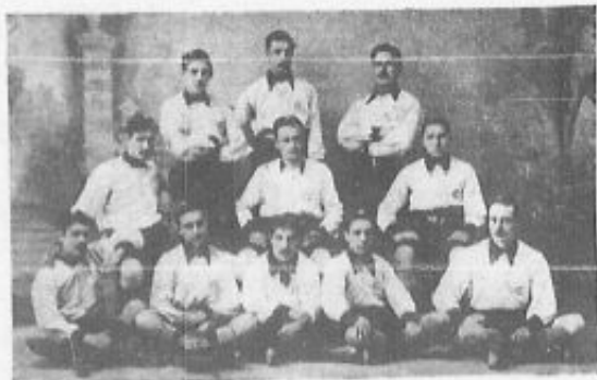
Team que compone el Gijón-Sport-Club.

Una de las crónicas aparecidas en las páginas de la revista Arte y Sport