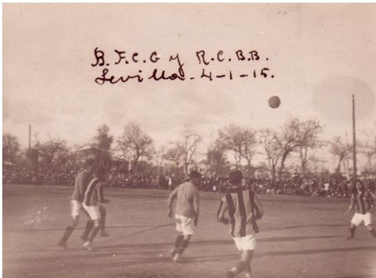
Imagen del partido contra el Britannia FC en el Prado de San Sebastián