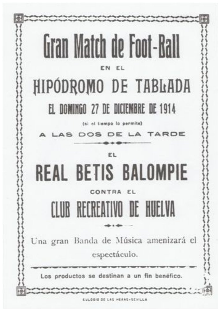
Cartel anunciador del partido contra el Recreativo de Huelva

El 21 de diciembre se solicitó a la Casa Real por parte del Real Betis Football Club autorización para unirse con el Sevilla Balompié, bajo la denominación de Real Betis Balompié. El día 23 la Casa Real dio su aprobación.