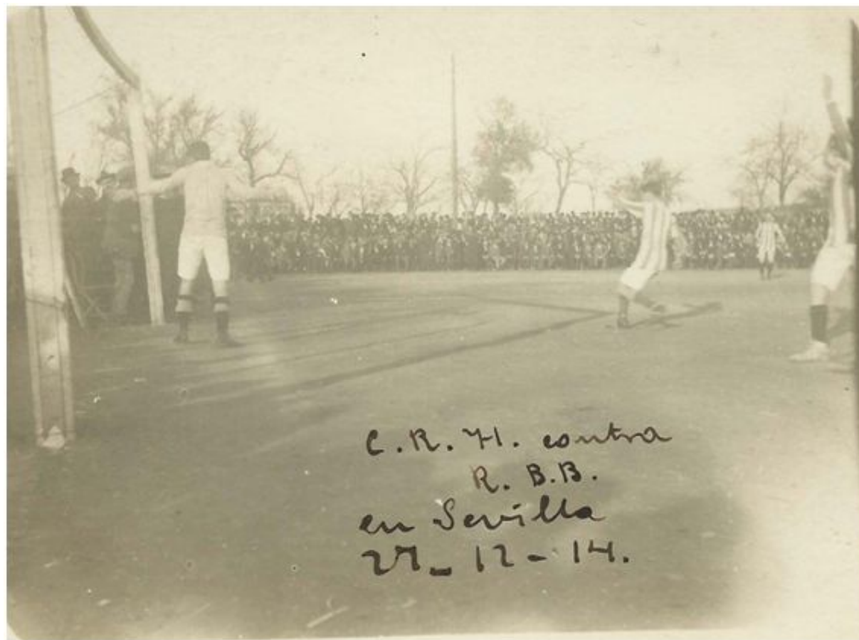
Imagen del partido contra el Recreativo en Tablada

Desde el primer momento el elemento balompedista será el predominante, dado su mayor potencial futbolístico y social. La mayoría de jugadores pertenecen al Balompié, así como los colores del club, que en su primer partido viste de verdiblanco, los colores de la sociedad balompedista, frente a los verdinegros del Betis. Incluso el primer presidente del Real Betis Balompié es Herbert Richard Jones, el presidente y jugador del Sevilla Balompié.