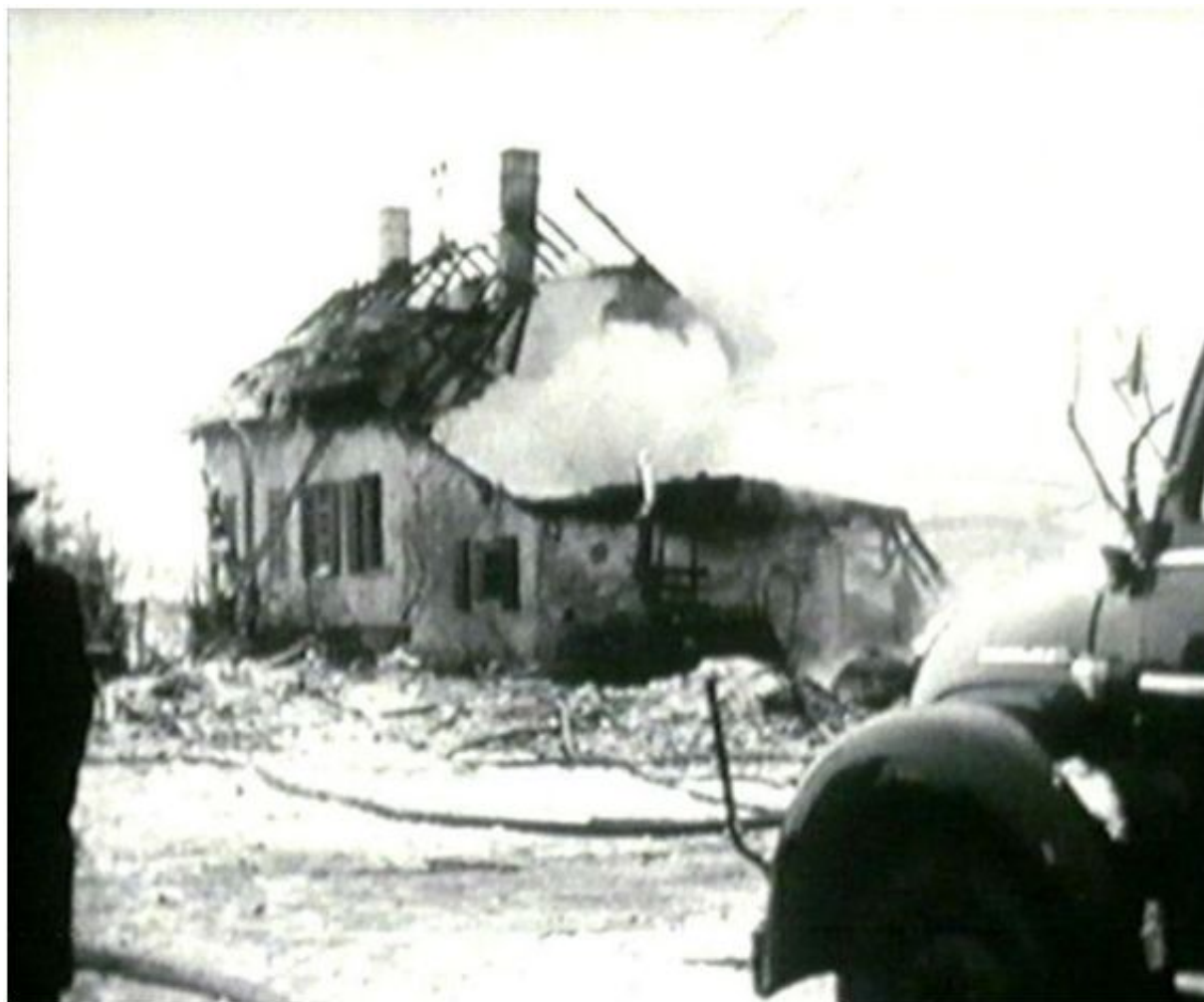
Casa contra la que chocó el avión del Manchester.