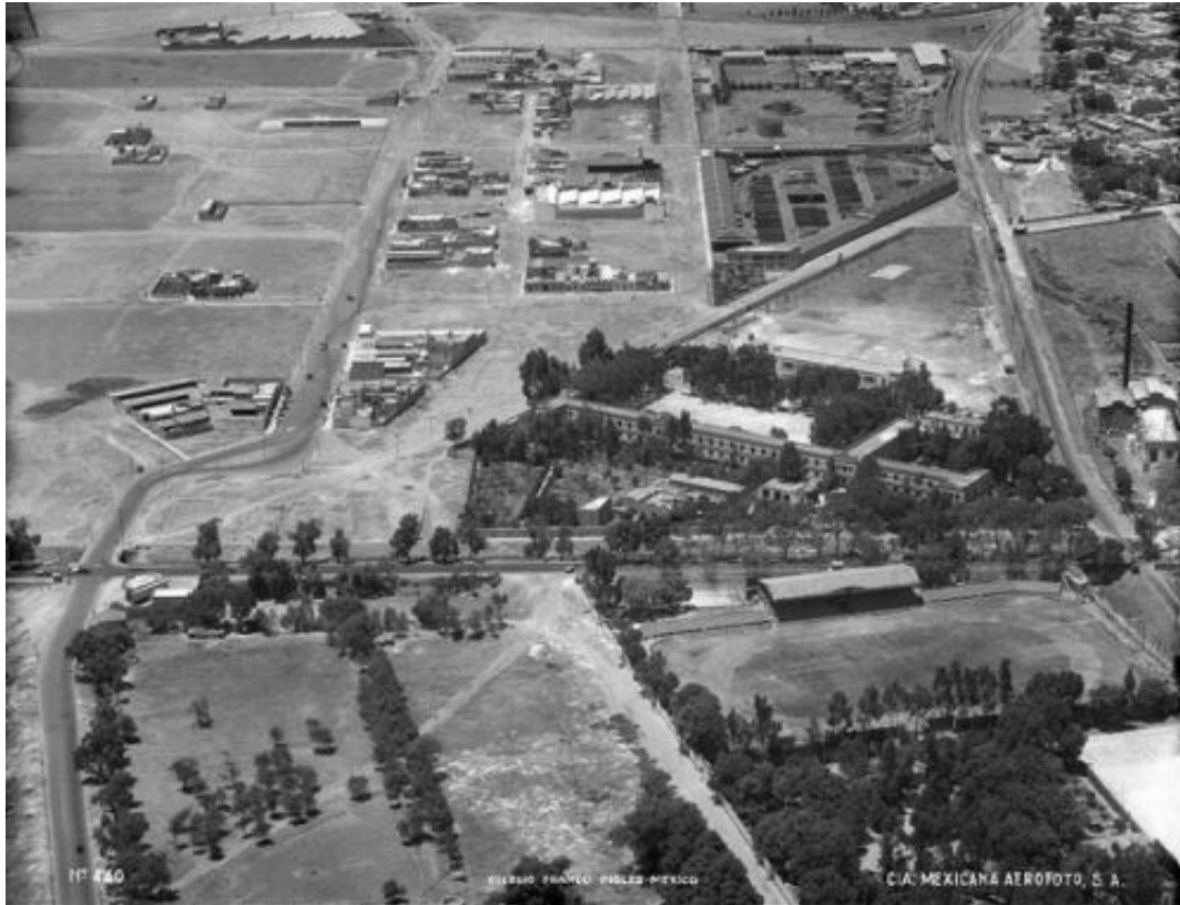
Parque España