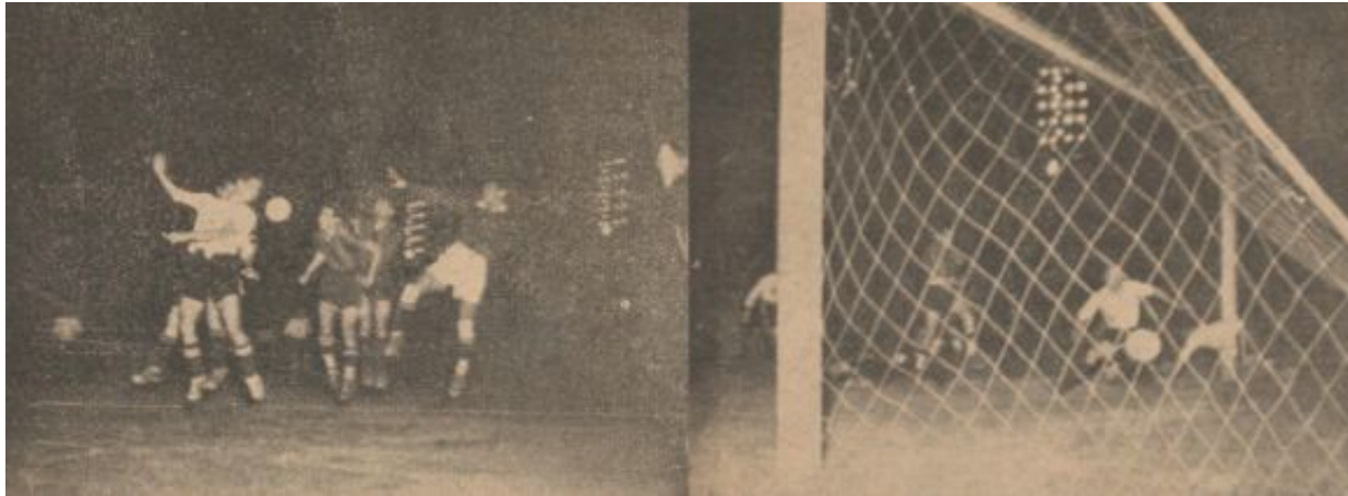
Jugada y gol del Primer Partido Nocturno en México Col. CarlosCalderónC

El estadio esa noche se encontraba a reventar. Todo mexicano afecto al fútbol quería presenciar tal acontecimiento. En las gradas llamadas de sombra, se podían apreciar hombres vestidos de traje y sombrero de copa y mujeres con sus mejores ropas que acudían cual si fueran a presenciar la ópera o el ballet. En las zonas populares, los obreros asistían también de traje o de mezclilla para ver lo que sería un espectáculo digno de contar.