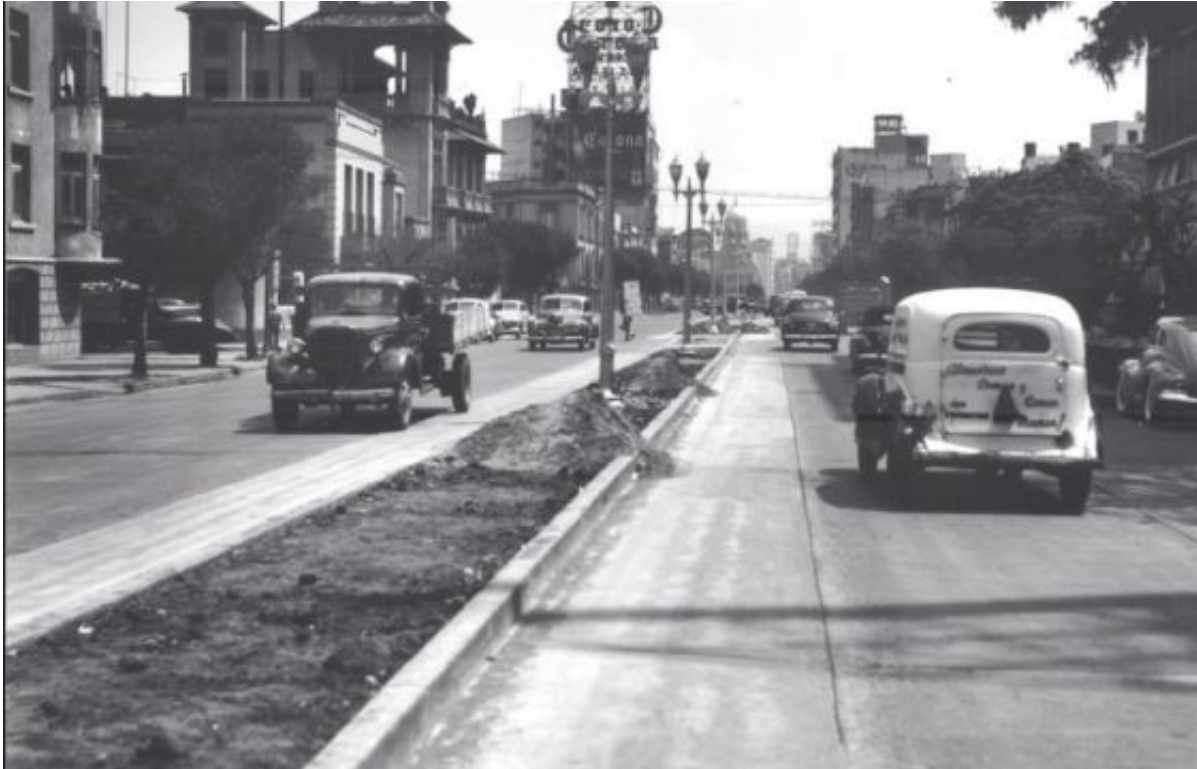
Insurgentes Sur y Álvaro Obregón, 1940c.

Remontémonos al pasado, muy atrás ha quedado ya 1940. En México gobernaba el general Lázaro Cárdenas i , las ciudades comenzaban a tener un despunte en relación a las zonas rurales y el fútbol en México era aún amateur.