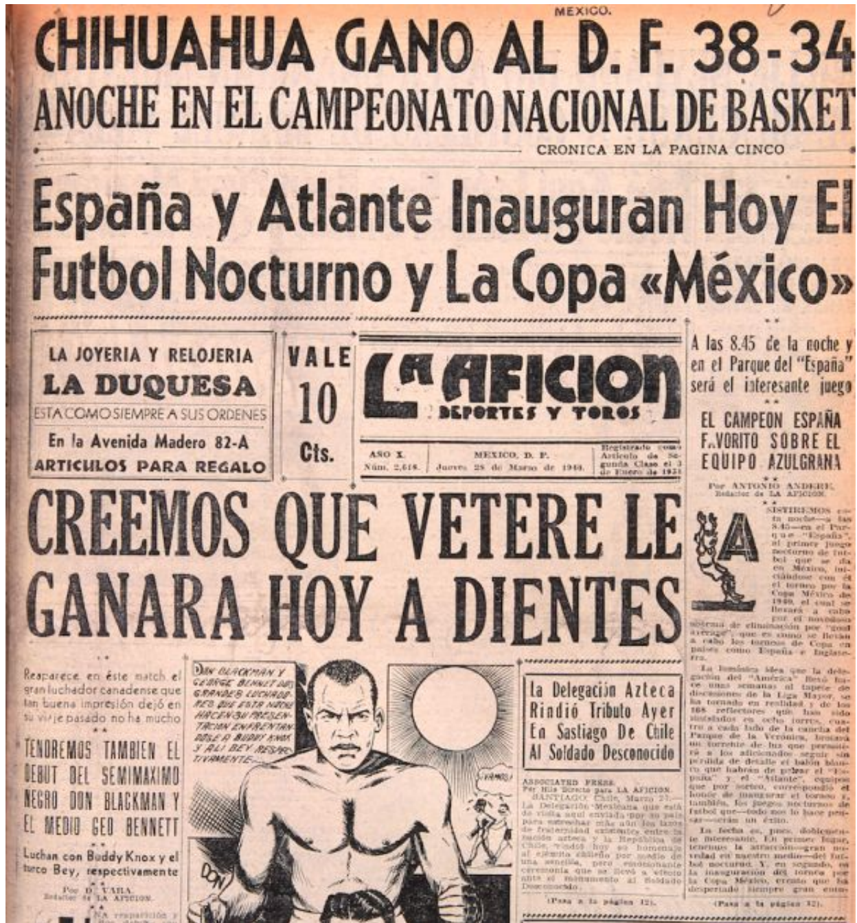
Portada La Afición 28 de marzo de 1940.

La compañía de Luz y Fuerza colocó postes de luz en las esquinas de la cancha y en las partes altas del inmueble. La cancha, perfectamente iluminada, salvo en la zona de corner, daba un espectáculo fabuloso. Las tribunas, en cambio, permanecieron en la más absoluta penumbra. Vendedores de botanas tuvieron que ayudarse de lámparas de mano y cerillas, para mostrar sus