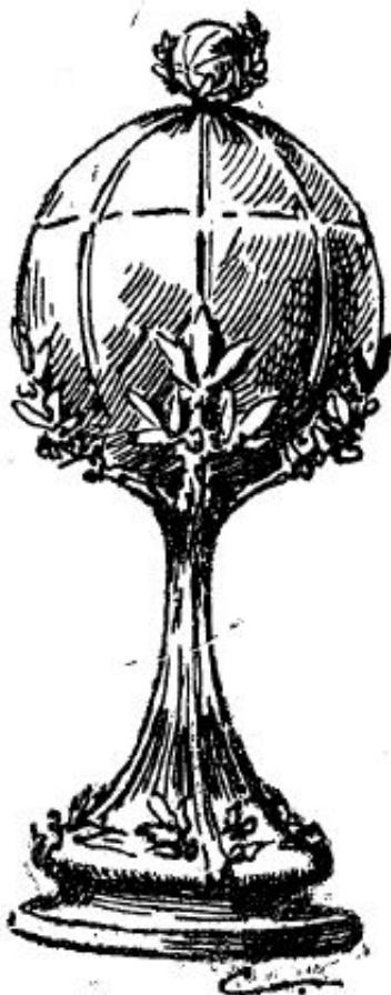
La copa de la Prensa

Así la describió La Voz de Galicia el 22 de junio: Sobre un elegante pie, surge, ceñido por ramas de laurel, un balón de plata, delicadamente imitado, coronado por artística poma.