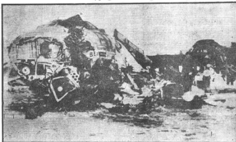
Estado en que quedó el biplano de la B. E. A. después de estrellarse a las pocas segundos de despegar del aeropuerto de Munich. Esta fotografía, tomada una vez sofocado el incendio, habla eloquentemente de las dimensiones del accidente que ha costado la vida a jugadores, directivos del Manchester y a varios periodistas británicos.

LONDRES 6 (Europa) (A. E.).—Se sabe posteriormente que en el avión viajaban además, aparte de los jugadores, seis destacados periodistas británicos, que habían acompañado al equipo para informar sobre el encuentro con el Real Madrid de Heligoland. Viajaban, además, miembros de la Embajada británica en Londres. Se sabe que seis periodistas británicos que