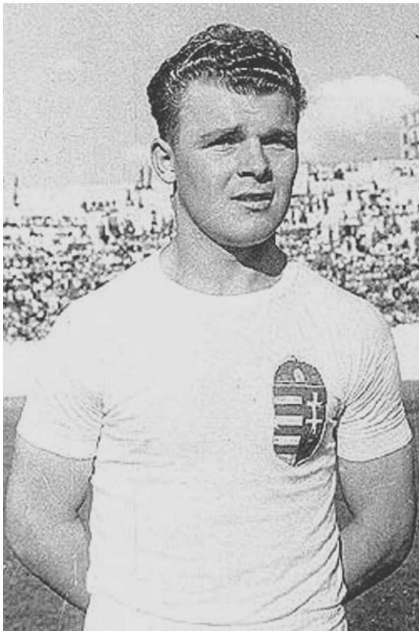
Kubala con la camiseta del Pro Patria.

Kubala y Czibor pudieron disputar la vuelta ante el CDNA de Sofía en un partido en el que el Camp Nou estrenó iluminación artificial (el partido empezó a las 22:30 de la noche). El conjunto de Helenio Herrera jugó un gran match y se impuso a su rival por un contundente 6 a 2. Los hogares con televisor pudieron disfrutar de la gran victoria azulgrana puesto que el partido fue ofrecido por televisión. La prensa destacó el buen partido de Kubala, autor de tres goles, dos de ellos desde el