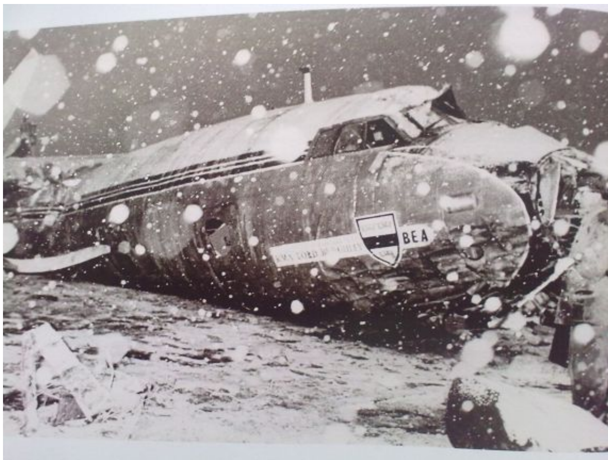
Imagen del avión que transportaba al Manchester United.

Pese al estado de shock que vivía, el Manchester United decidió disputar las semifinales de la Copa de Europa. Así, dos meses después de la tragedia de Múnich, los 'diablos rojos' afrontaron el duelo contra el Milan. Pese a ganar por 2 a 1 en la ida con un XI de circunstancias, el conjunto inglés no tuvo opción en la vuelta y encajó un 4-0 en San Siro. En 1968, diez años después de la desgracia sufrida en Múnich, el Manchester United logró la primera Copa de Europa para el fútbol inglés (que no británico; Celtic, 1967). Entre los campeones estaban Matt Busby, Bobby Charlton y Bill Foulkes, todos ellos supervivientes del accidente de 1958.