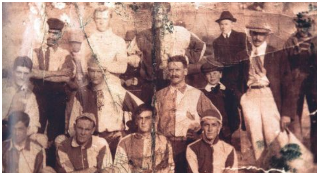
Equipo Pachuca Athletic Club

1 Porfirio Díaz fue presidente de México en varios periodos, 1876 (noviembre- diciembre), 1877 febrero -mayo), 1877 (mayo-noviembre) y de 1884-1910.