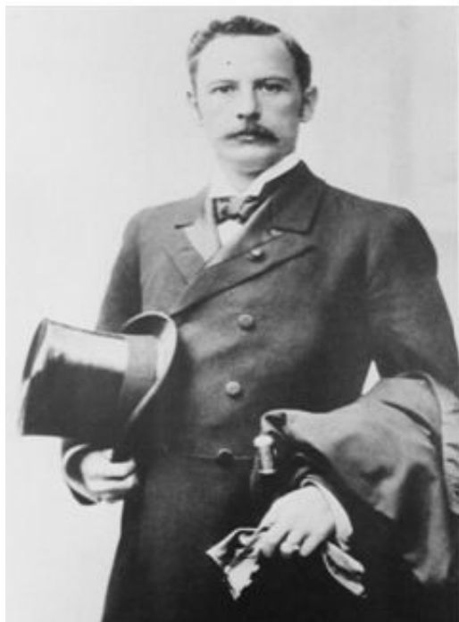
Lic. Rafael Iglesias Castro. Presidente de Costa Rica (1894-1898) y (1898-1902)

Lo anterior permite esbozar la idea de que el Presidente Iglesias trataba de impulsar el fútbol como un deporte de interés nacional, al cual tenía acceso el sector popular costarricense. Aunque es probable que el verdadero interés de don Rafael en el fútbol era recobrar popularidad, ya que es sabido que gobernó en forma dictatorial durante los ocho años que estuvo en el poder. 12