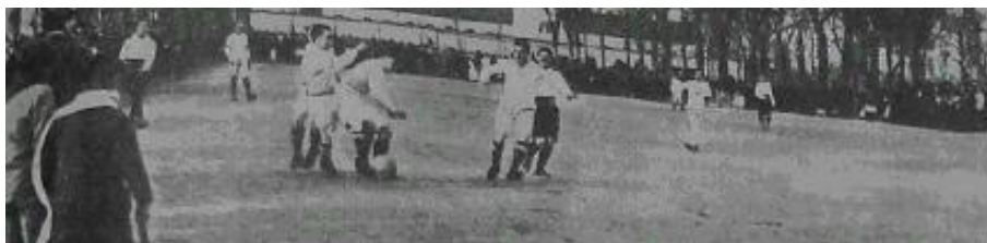
Imagen del partido.