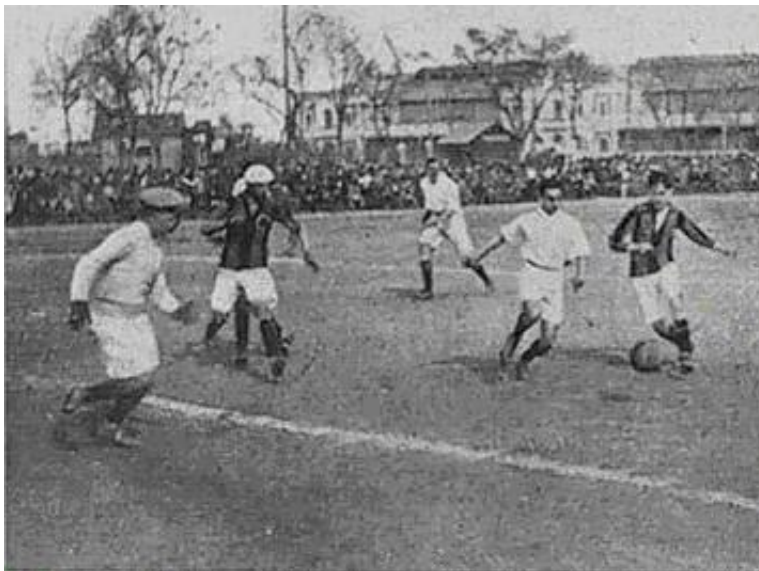
Imagen del partido.