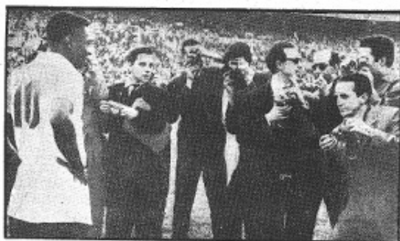
PELÉ, LA ATRACCIÓN.—La jeme del Santos se enfrenta en su presentación a nuestro ídolo, el "moreno" Pelé. Es lógico, pues, que antes de comenzar el juego el recordista zuleador se viera así de asediado por los fotógrafos madrileños.

Con fútbol rápido, excelente marcaje y buen juego de ataque, los madrileños se impusieron sobre los brasileños Pelé y sus hombres --muy lentos en general-- sólo se mostraron efectivos en el disparo