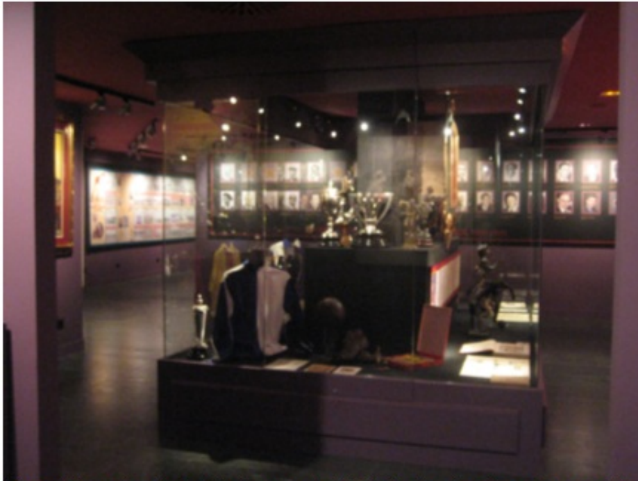
Vista de la sala principal del museo de la RFEF, donde se haya la carta. Madrid.