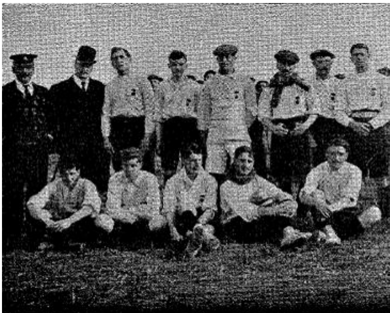
Real Club Deportivo F. C. de la Sala Calvet de «La Coruña».

En La Coruña, bajo un sofocante calor se ha disputado un reñido encuentro entre el Real Club de Coruña y el Fortuna de Vigo, ganando los coruñeses por 4 a 0.