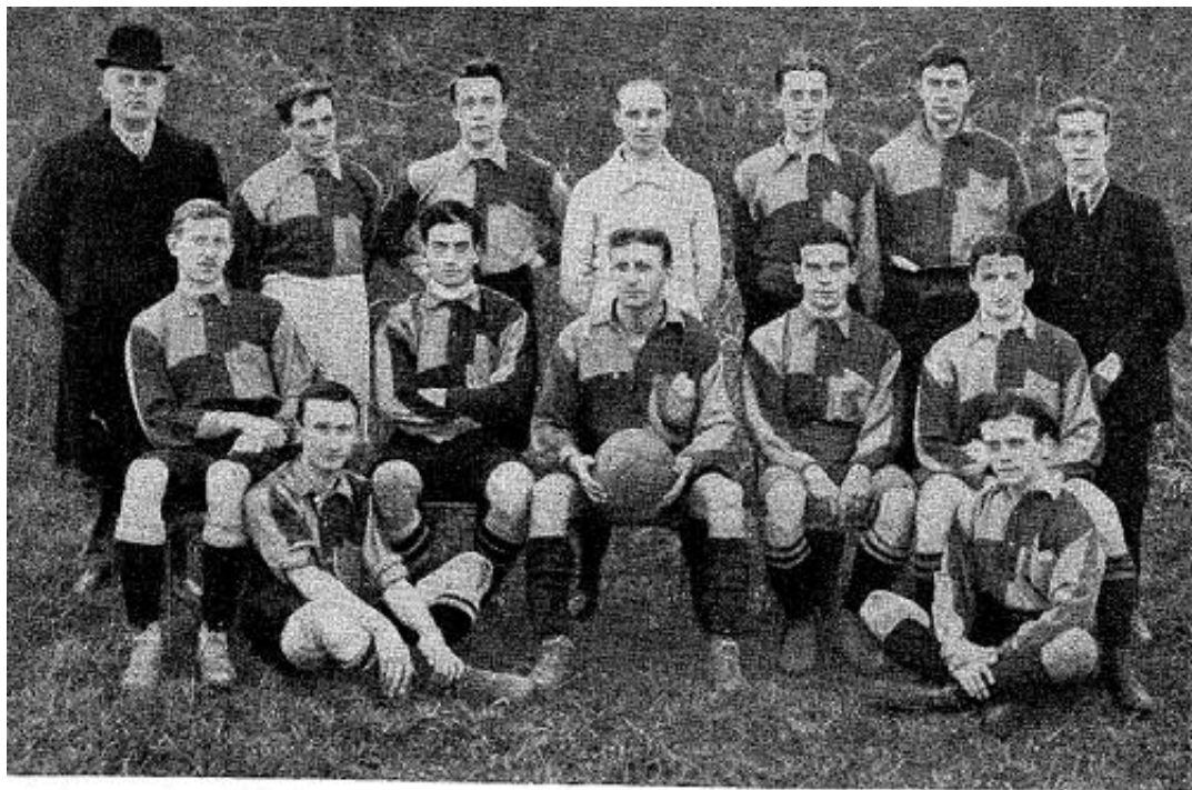
Primer team del «Cardiff Corinthians» que, con ligeras modificaciones, vino á Barcelona para luchar con los clubs catalanes.

Aprovechando la visita de los británicos, la colonia inglesa en la Ciudad Condal organiza una fiesta deportiva en el campo de la calle Montaner en honor del Cardiff Corinthians.