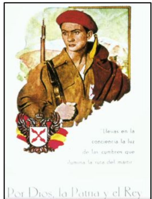
Propaganda carlista, con su lema de cabecera. La contribución navarra a las

Su rival directo, el Oviedo, virtualmente desaparecido durante el ejercicio 1939-40, si contabilizó decesos entre el grupo de más fieles e irreductibles adeptos -que los hubo en abundancia-, no parece participase ningún listado y, en todo caso, los días de homenaje e incienso eclesiástico pasaron de largo, sin crespones, siquiera, o la enseña azulona ondeando a media asta.