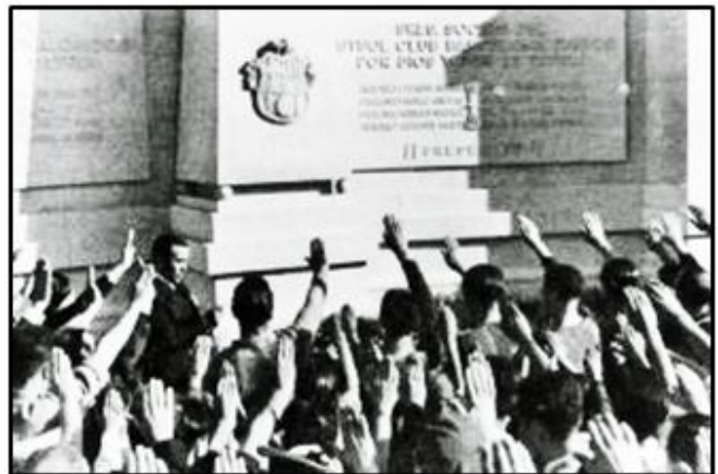
Monumento del F.C. Barcelona a sus socios del bando nacional caídos.