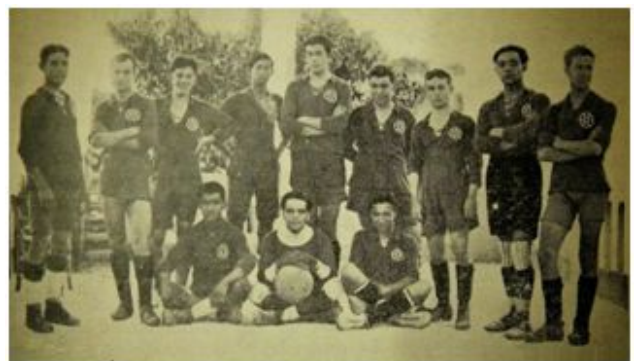
Equipo del Veloz Sport Balear (1920)