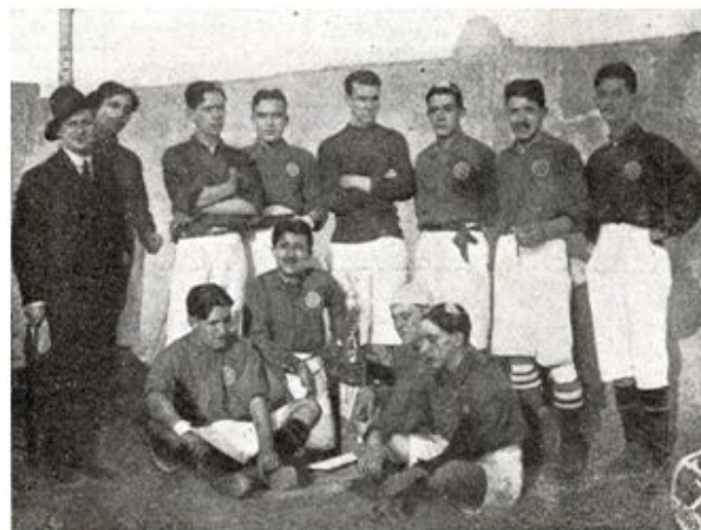
Equipo del Veloz Sport Balear durante las Fiestas Constantinianas (1913)

La piedra de toque que calibraba el nivel real del fútbol insular eran los partidos contra los equipos de escuadras navales extranjeras. En ellos el VSB, año tras año, salía escaldado sin remisión: