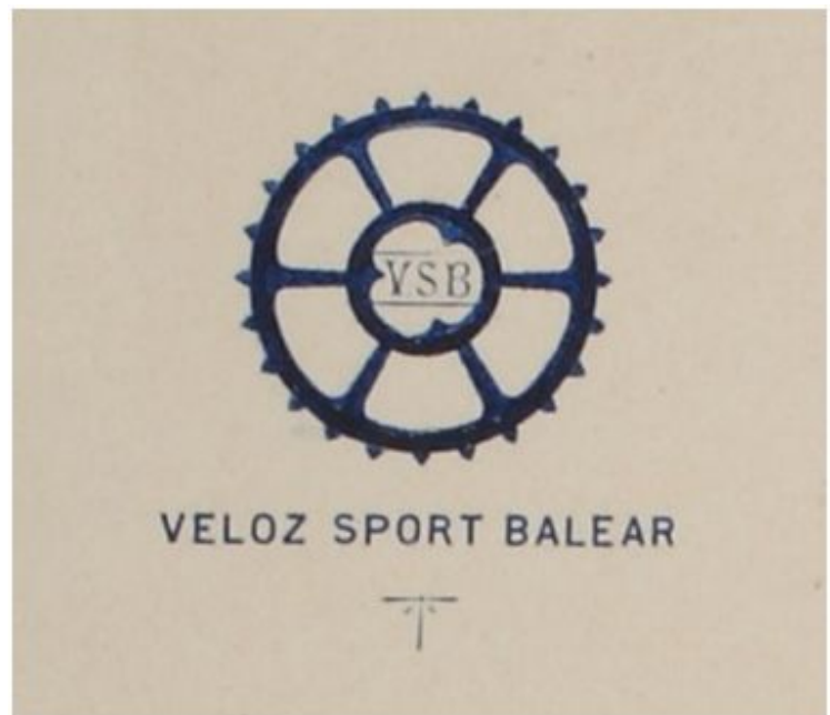
Escudo del Veloz Sport Balear (1915)

El 1 de septiembre de 1896 se fundó en Palma (Mallorca) la sociedad Veloz Sport Balear , entidad trascendental en el desarrollo de la práctica deportiva en las Islas Baleares. Fue creada como una entidad dedicada al fomento del ciclismo, deporte que en aquellos años se había convertido en la más importante manifestación deportiva de Mallorca. Y así fue, salvo en las últimas décadas (hoy sobrevive aún, como un humilde club social); y también en sus primeros años, como veremos a continuación.