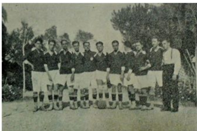
Equipo del Veloz Sport Balear (1925)

En esta etapa el VSB solo alcanza a jugar partidos amistosos contra equipos pequeños. Nunca llega a federarse (por tanto, jamás ha disputado un partido de liga) y en todo momento estuvo lejos del nivel de los grandes equipos, con quienes no disputa ningún enfrentamiento directo. El equipo fue espaciando gradualmente sus intervenciones durante 1925 y, aunque llegó a disputar un último partido contra un equipo de la escuadra inglesa (2-4), nunca se mostró fuerte.