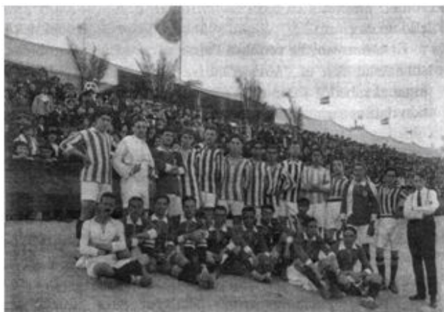
Equipos del Veloz Sport Balear (camisetas lisas) y del CS Manresa (camisetas a rayas) durante un partido en el velódromo del Tirador (1916)

A finales de 1915 hubo un nuevo repunte de la práctica futbolística en Palma (tan aleatorio e inconstante como los anteriores) y el VSB aprovechó para organizar un nuevo Campeonato de Baleares que se celebró entre diciembre de 1915 y mayo de 1916 con participación de ocho equipos (siete de Palma y el campeón de Menorca, el Mahón FC ). El VSB participó con dos equipos, el Veloz (primer equipo) y el X (segundo o reserva). Ambos equipos velocistas se impusieron claramente en la fase de Mallorca: el primer equipo campeón y el X quedó segundo. Posteriormente, en la final del Campeonato de Baleares el VSB se proclamó campeón por renuncia del campeón de Menorca, el Mahón FC . Nuevamente hubo polémica, ya que los mahoneses acusaron a los velocistas de reforzarse con jugadores peninsulares poco antes de la final. Una vez más, la falta de una norma federativa, la improvisación y la arbitrariedad impidieron celebrar una competición en condiciones.