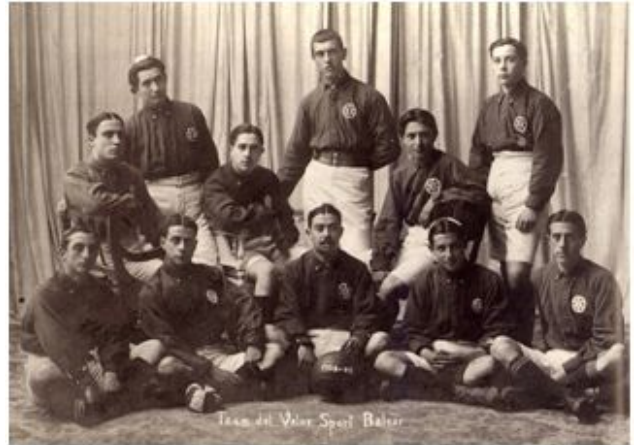
Equipo del Veloz Sport Balear, campeón de Mallorca y subcampeón de Baleares (1909)

Durante los cuatro años siguientes la actividad futbolística en Mallorca fue prácticamente nula. Solo hubo dos asomos de reactivación sin continuidad: en mayo de 1907, con un partido de homenaje al recién nacido heredero de la Corona entre dos combinados del VSB; y en febrero de 1908, con un partido del VSB contra un equipo de torpederos ingleses, saliendo ampliamente derrotados los locales (4-7).