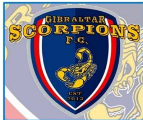
Escudo del Gibraltar Scorpions, modesto aunque ambicioso equipo en la 2ª División gibraltareña.