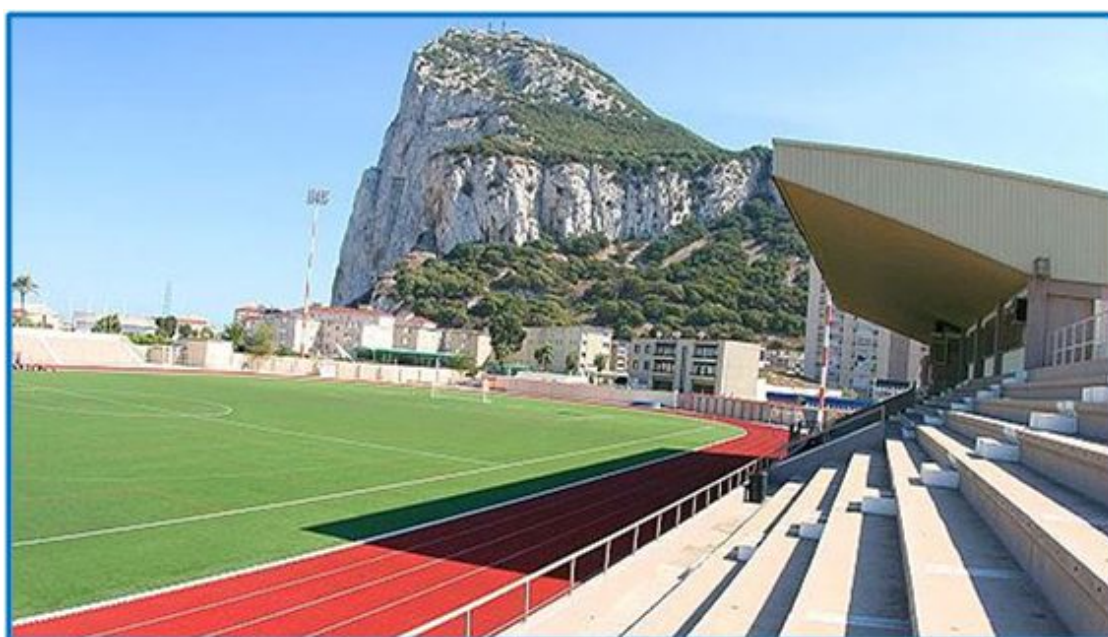
El Victoria Stadium, único campo gibraltareño y por