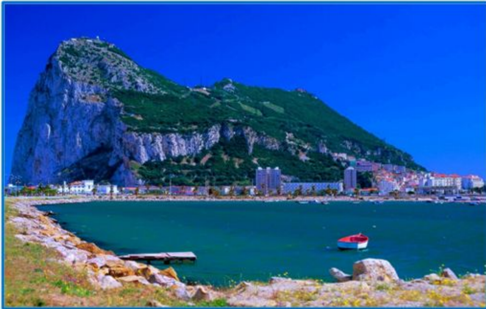
Gibraltar en la actualidad. Puerto, base naval, turismo y paraíso fiscal.

Gibraltar nunca dejó de suponer pieza discordante entre España e Inglaterra. Con regularidad monótona servía para que ambos reinos se enzarzaran. Menorca volvió a formar parte de nuestra nación, pero el peñasco, por su importancia estratégica, resultaba innegociable. Y de ahí que las armas siguieran atronando, como ocurriera durante el Gran Asedio (1779-1783) en el contexto de la Guerra de Independencia de los Estados Unidos, nuevo intento de recuperación española donde, por cierto, habría de perecer, entre otros muchos, el escritor gaditano José Cadalso.