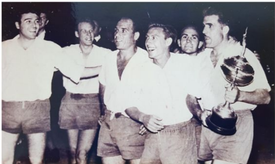
El CF Sóller con la Copa Uruguay, temporada 1959-60

En semifinales se clasificaron los mejor clasificados de Tercera División: CF Sóller y UD Poblense, además del sorprendente CD Soledad y el no menos sorprendente CD Manacor, campeón de Tercera, pero que competía con el reserva. Se impuso el CF Sóller, con lo que el torneo seguía sin reeditar campeón.