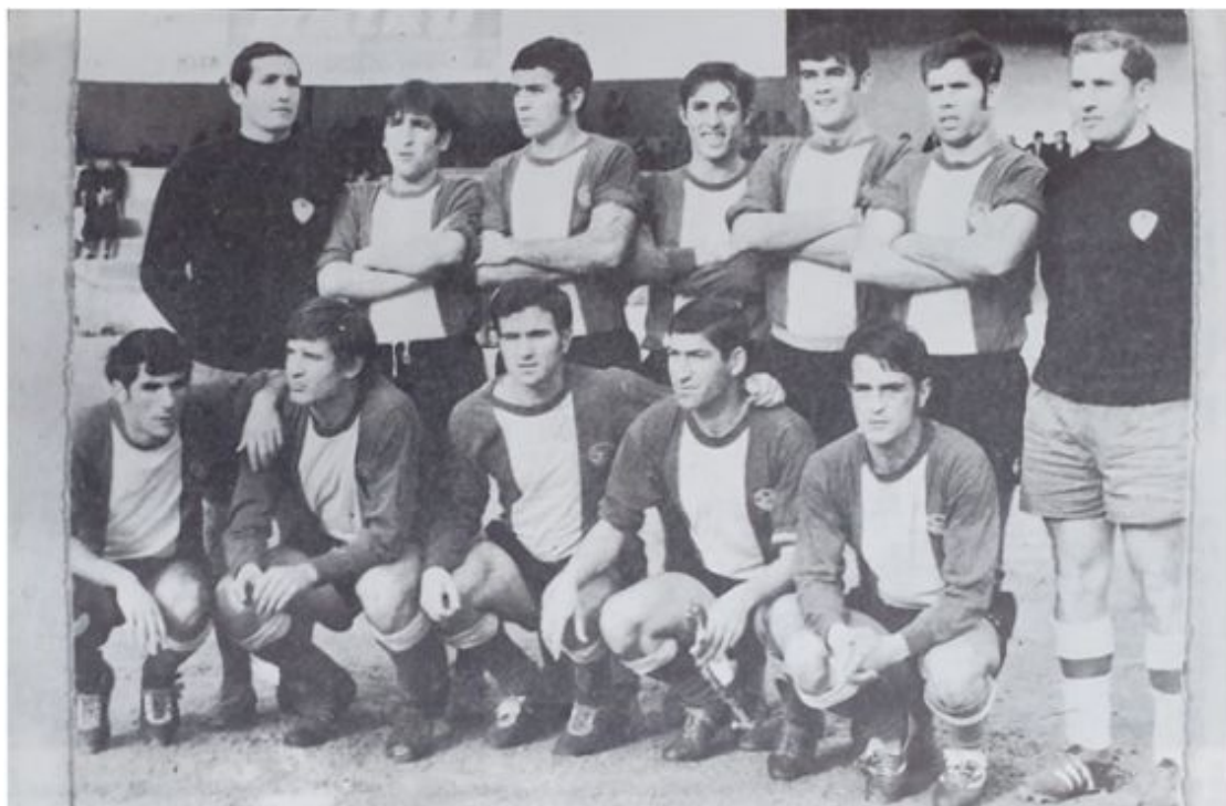
UD Mahón, años 60 (Deseado Mercadal, El juego del fútbol en Menorca)