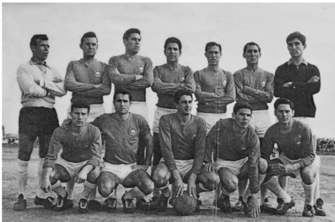
SD Ibiza, temporada 1962-63