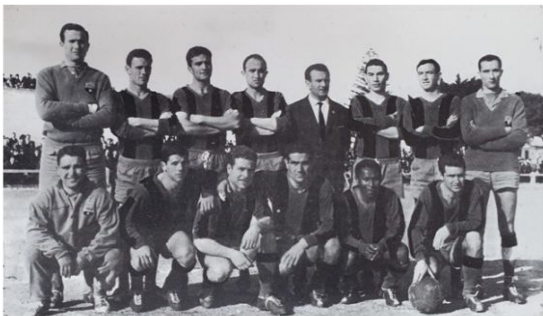
CD Menorca, temporada 1964-65 (Deseado Mercadal, El juego del fútbol en Menorca)

En sendos grupos la victoria fue cosa de dos equipos. CD Atlético Baleares y CD Menorca se impusieron respectivamente y se enfrentaron en la gran final. Finalmente se impusieron los mallorquines, que conseguían su segundo título de Copa Uruguay después de una primera edición (1959) y encadenar dos subcampeonatos (1964 y 1965).