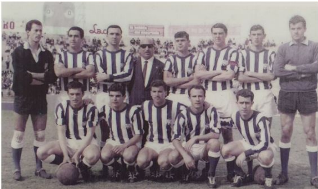
CD Atlético Baleares, 29 de abril de 1966 (Antoni Salas, L'Atlètic Baleares. La història en imatges)

De este modo el CD Atlético Baleares lograba su tercer título y segundo consecutivo, lo cual ponía al club blanquiazul en cabeza como equipo con más ediciones ganadas y ante la posibilidad de lograr la Copa Uruguay en propiedad si enlazaba un tercera victoria consecutiva.