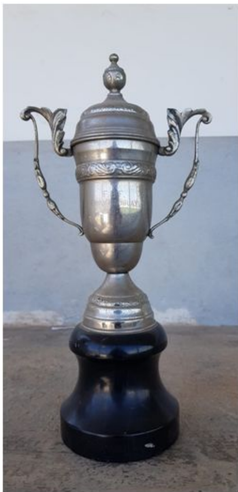
Copa Uruguay, temporada 1960-61