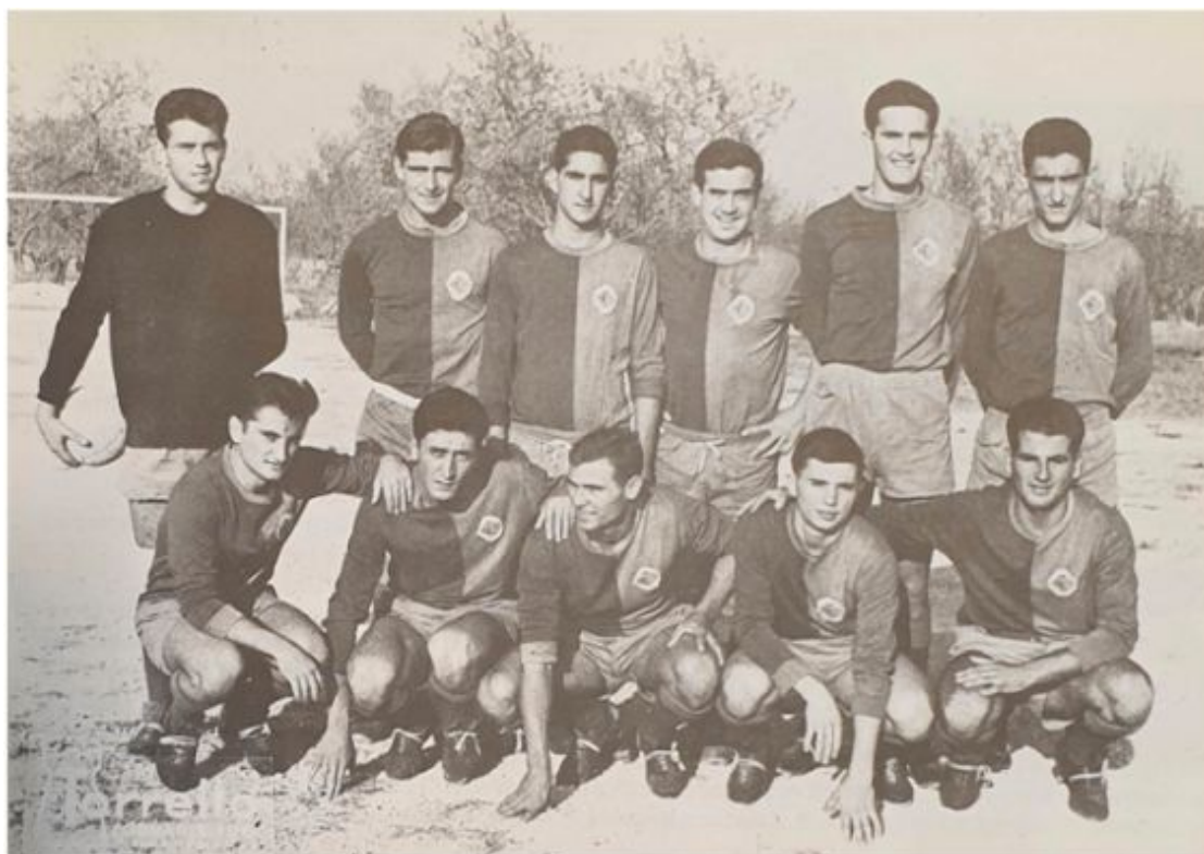
CD Soledad, temporada 1962-63 (Beco: El deporte en la barriada de La Soledad)

jornada se enfrentaron el Soledad (15 puntos) y el Atlético Baleares (14), en casa del último y con el campeonato en juego. Venció el conjunto balearico (1-0), pero un recurso de los soledistas les dio por ganado el encuentro y, con ello, el triunfo final. La victoria incorporaba el cuadro del CD Soledad a la nómina de ganadores de la Copa Uruguay y alejaba un año más el desenlace del torneo.