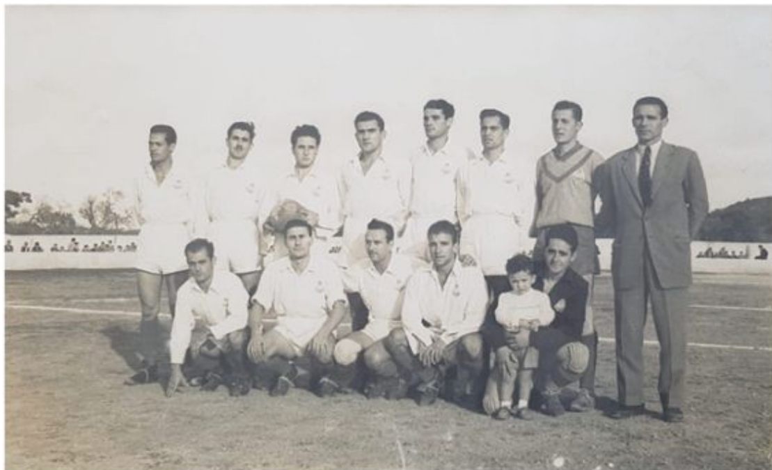
CD Felanitx, temporada 1954-55