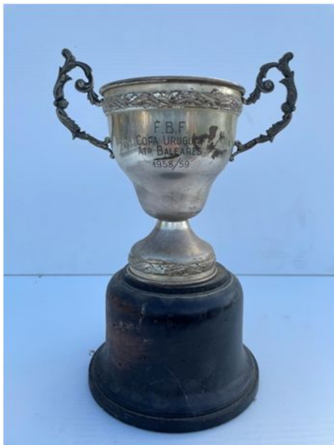
Copa Uruguay, temporada 1958-59