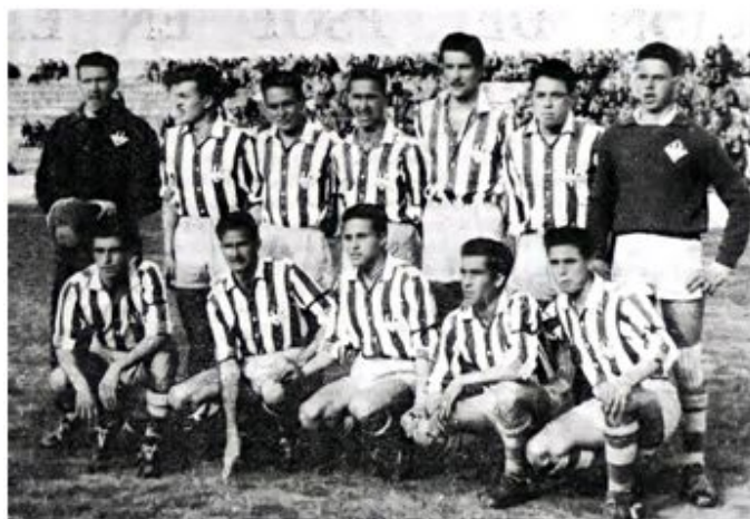
CD Manacor, temporada 1955-56 (Manacor, 25 de octubre de 1980)