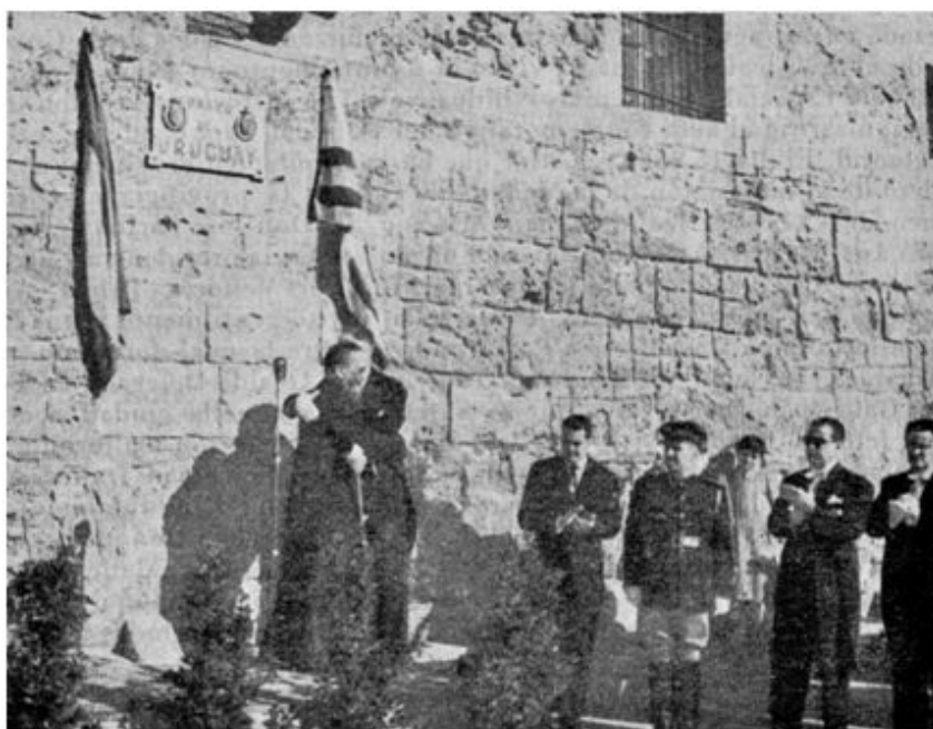
Acto de rotulación del Paseo del Uruguay. Palma, 20 de enero de 1955 (Memoria de Secretaría del ejercicio del año 1955. Ayto. de Palma, 1956)