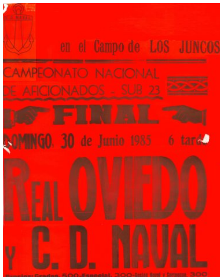
Cartel del partido