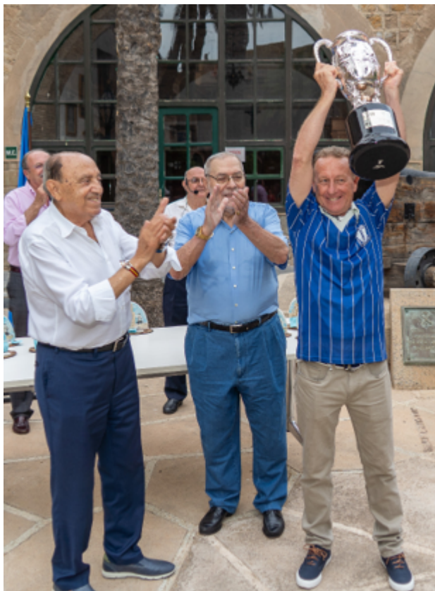
Mismos protagonistas, 40 años después.