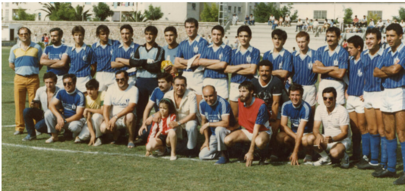
Plantilla al completo de la gesta del 30 de junio de 1985