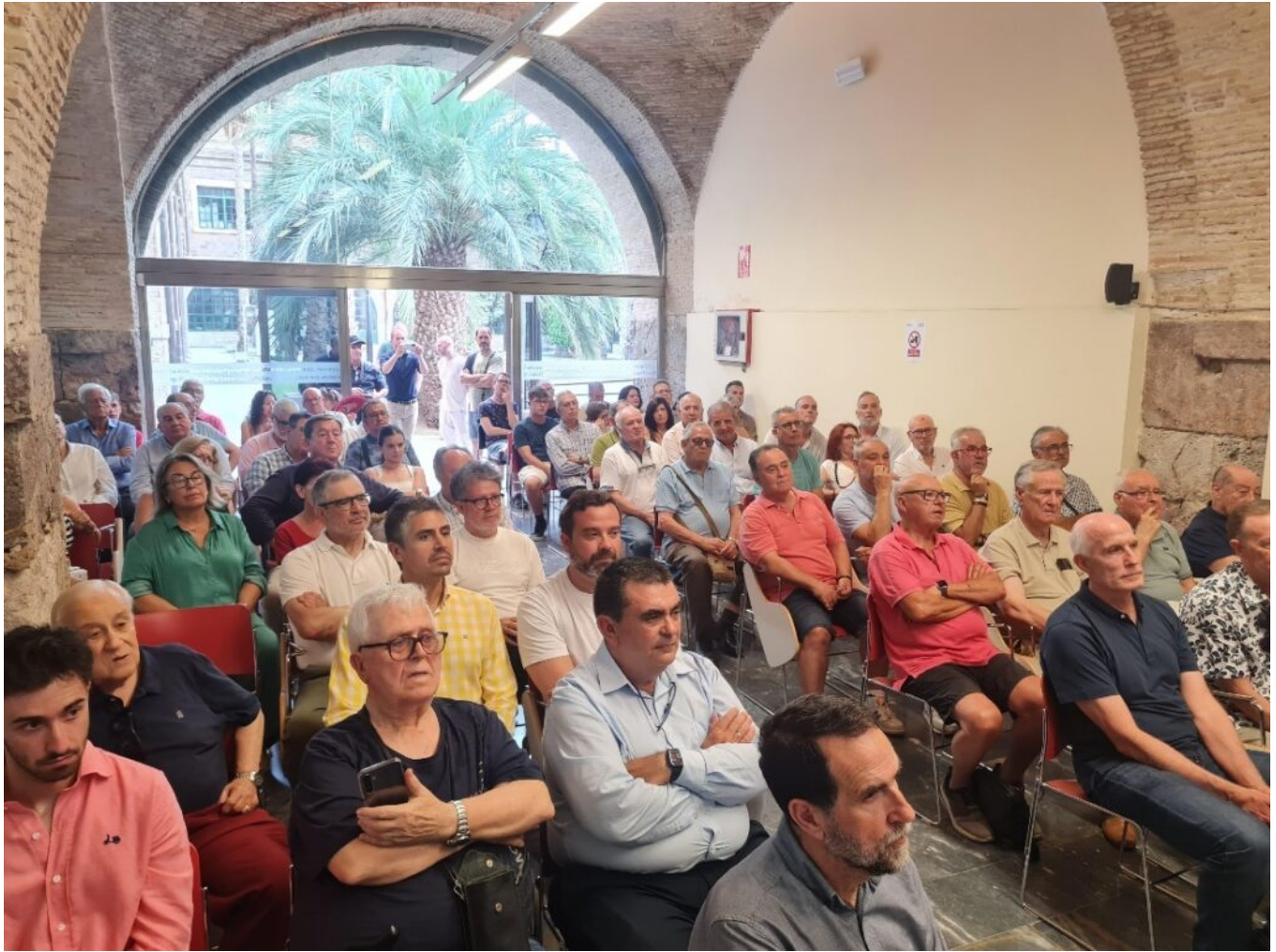
Lleno absoluto en la sala multiusos del Archivo Municipal de Cartagena