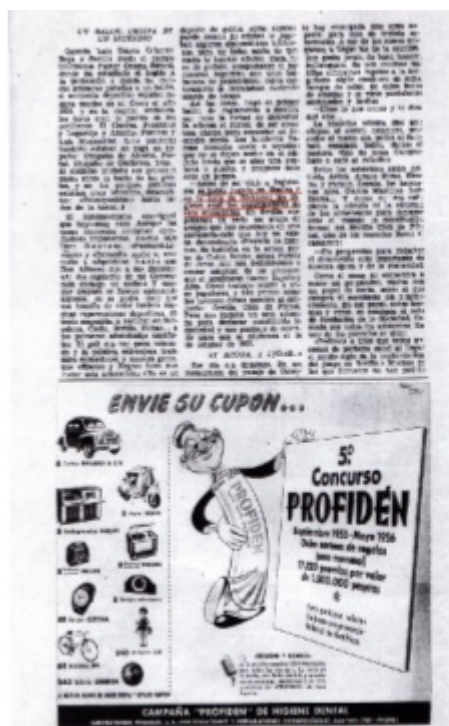
Revista "EL ESPAÑOL". Septiembre 1955 (AHM Sevilla)

argue en pompa. —Antes de mi viaje a Inglaterra se había jugado en Huelva y en la zona de Riotinto; los ingleses eran los organizadores de esos encuentros. En Sevilla empezamos en serio un grupo de amigos que nos reuníamos en una cervecería-café que hoy no existe, denominada «Nevería de Esclava». Se hablaba en la actual plaza de Calvo Sotelo, antes Puerta de Jerez. Allí nos dedicábamos a