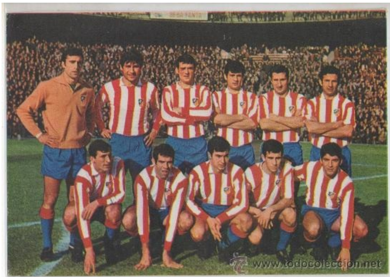
Atlético de Madrid 1967-68.