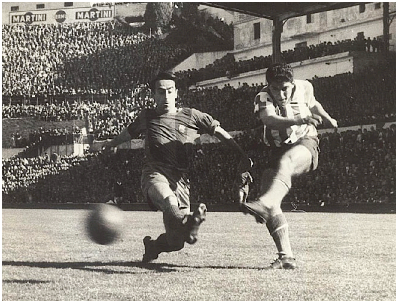
Collar y Flotats.