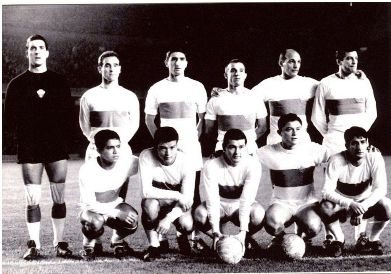
Elche 63-64 Camp Nou.

hondureño Cardona y sus paisanos Romero y Eulogio Martínez, igualmente recién llegado, que acababa de actuar en el Mundial de Chile con la Selección Española -junto a otros nacionalizados como Santamaría y Puskas- y que iba a cobrar la ficha más elevada de toda la plantilla, casi un millón de pesetas de la época (Lezcano, por su parte, tendría que contentarse con unos emolumentos mucho más modestos: tan sólo 150.000 cucas ).