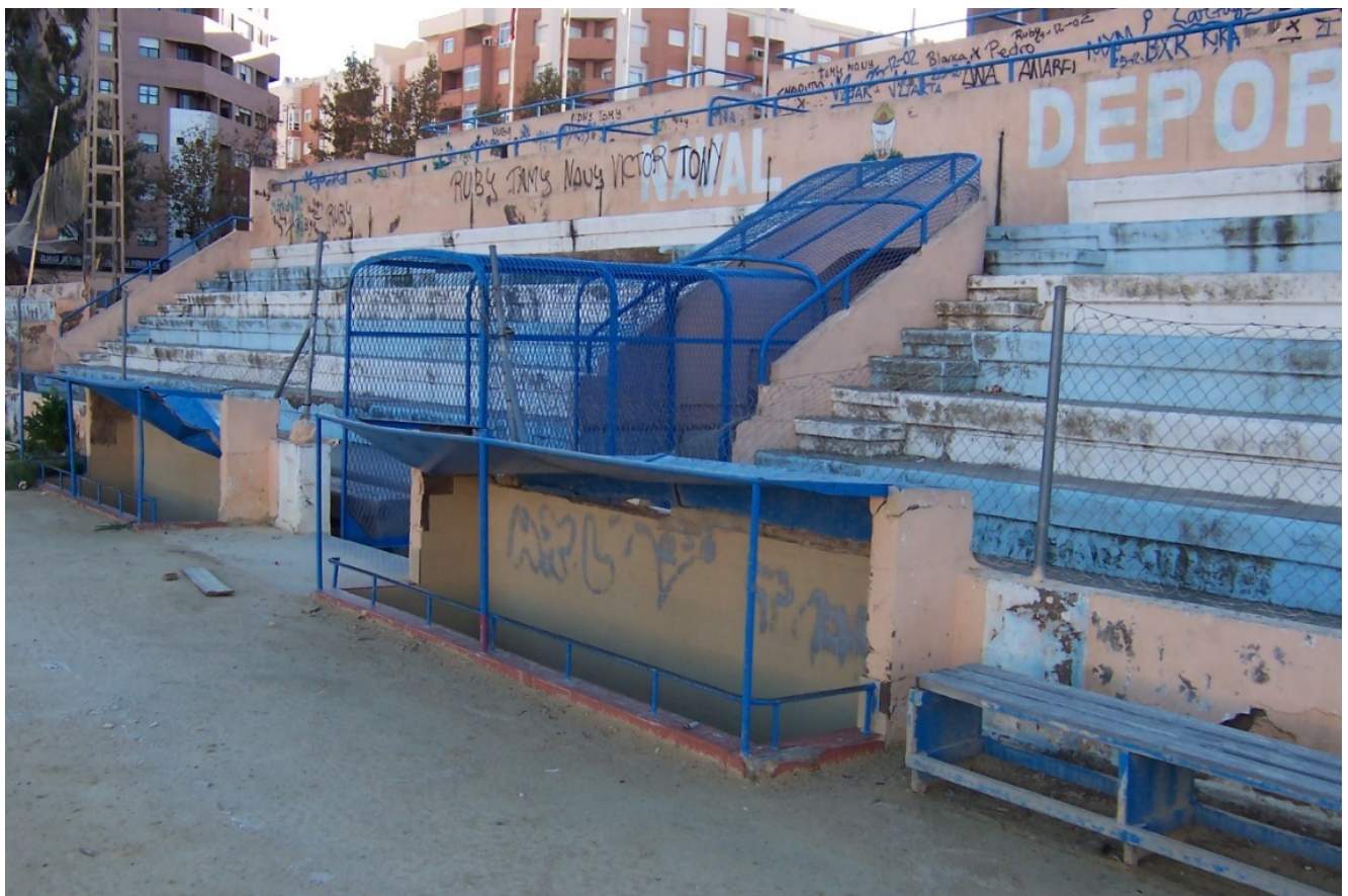
Los Juncos, meses antes de su demolición