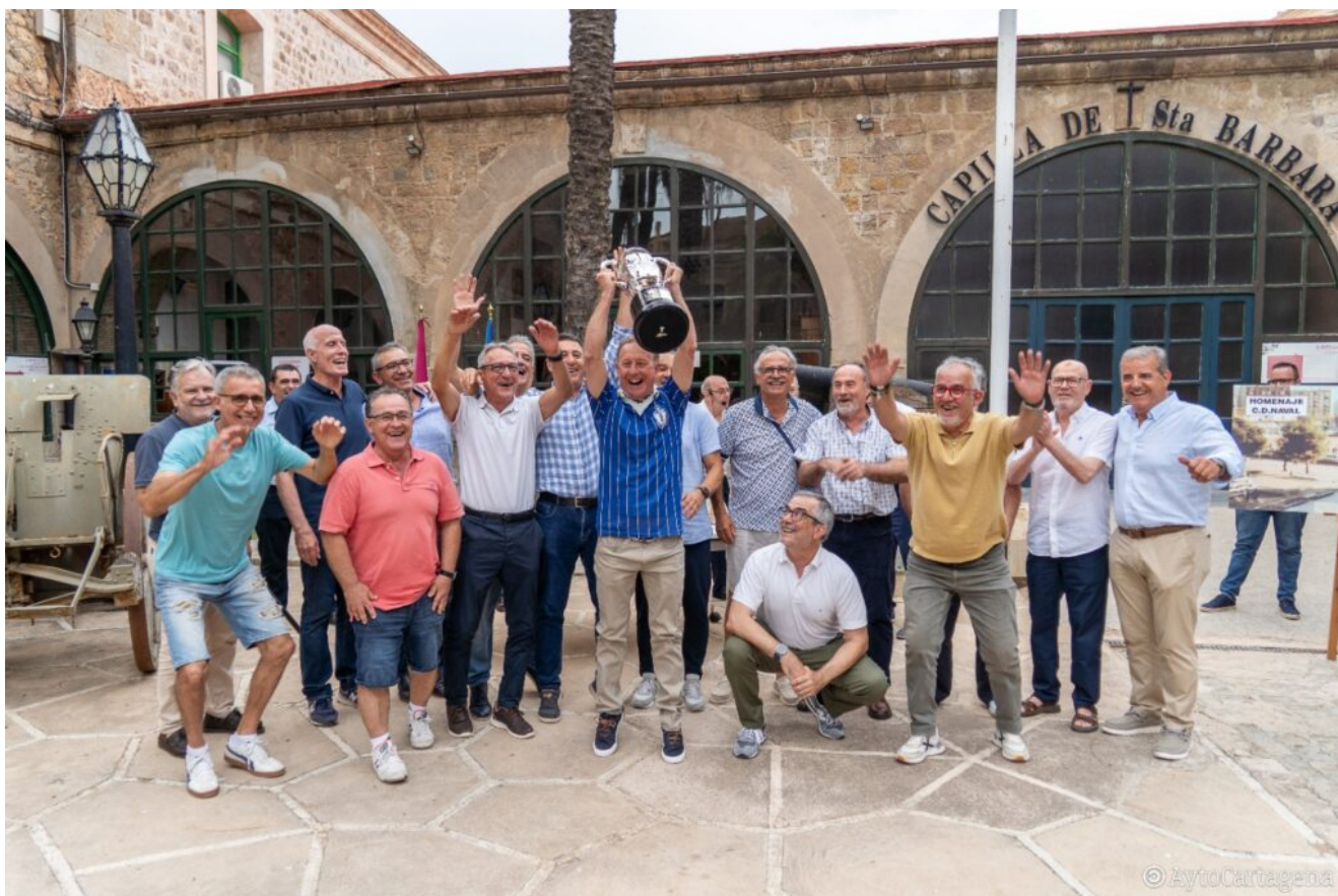
La plantilla del CD Naval 1984/85 rememora la consecución del