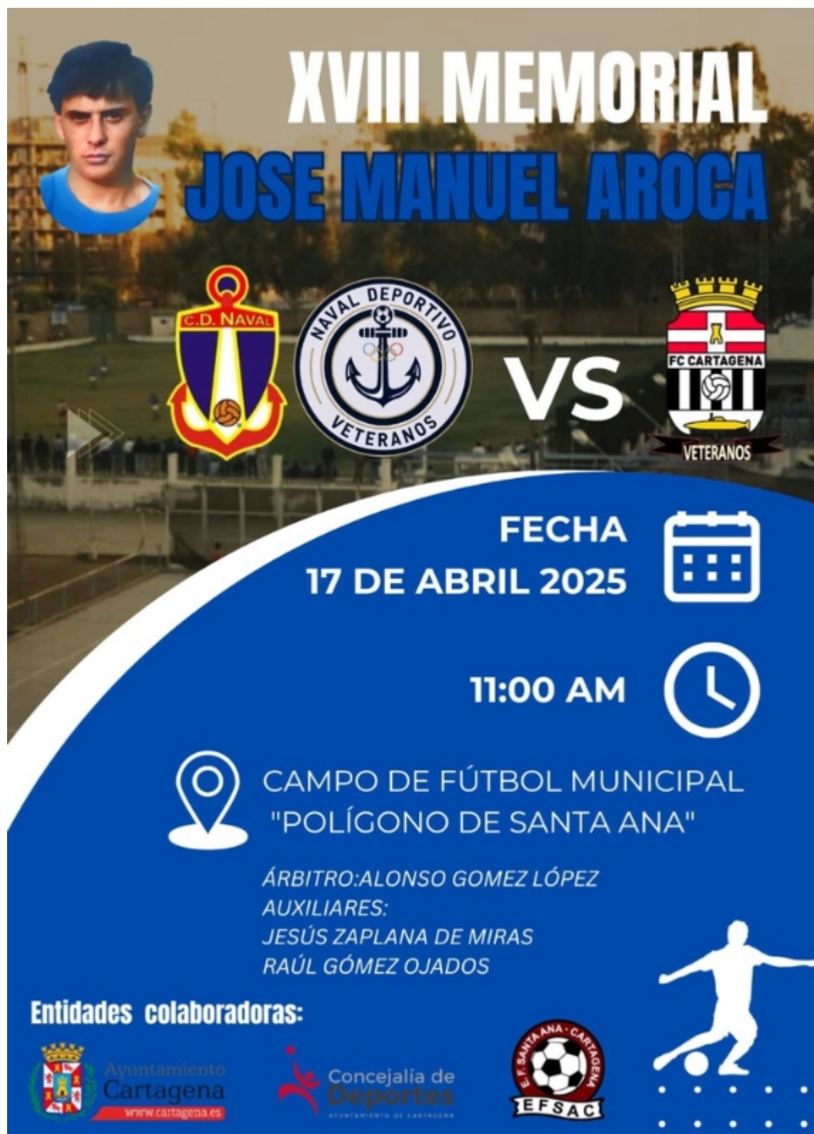
Cartel de la última edición

Durante los años 80 y 90, el CD Naval surtiría al Cartagena FC de jugadores por encima de la media que, normalmente, se había vivido en Cartagena. De la foto inferior, casi la totalidad del once inicial, llegaron a la primera plantilla del Efesé.