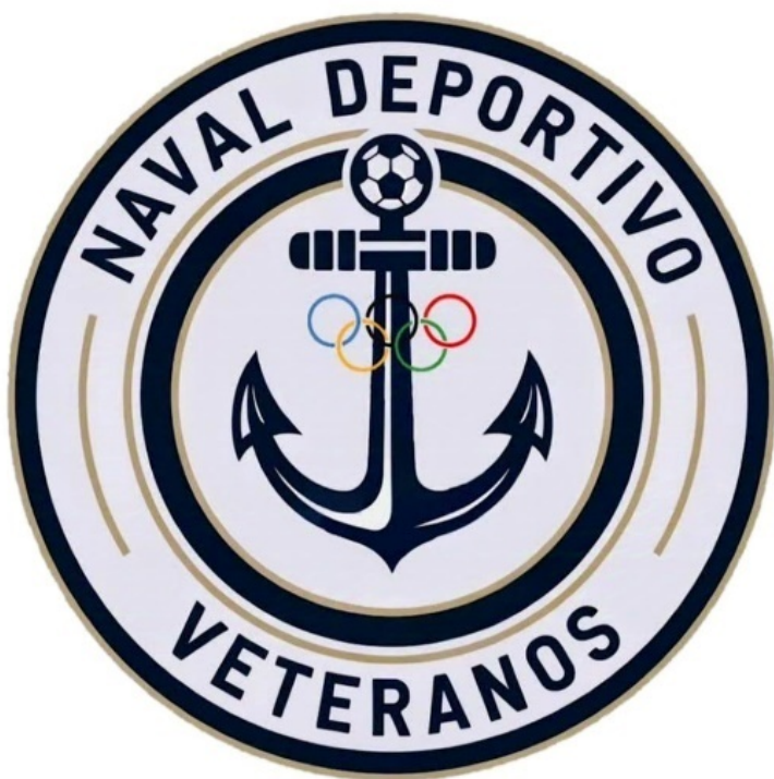
Escudo del Naval Deportivo Veteranos

Además, los veteranos de este sentimiento, recientemente han fundado el Naval Deportivo Veteranos