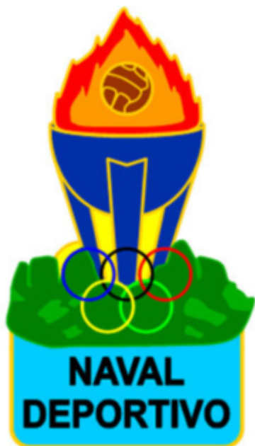
Escudo del Naval Deportivo