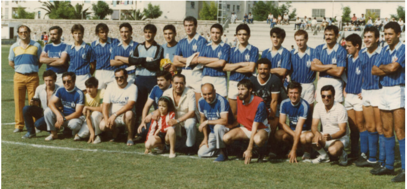
Plantilla al completo de la gesta del 30 de junio de 1985