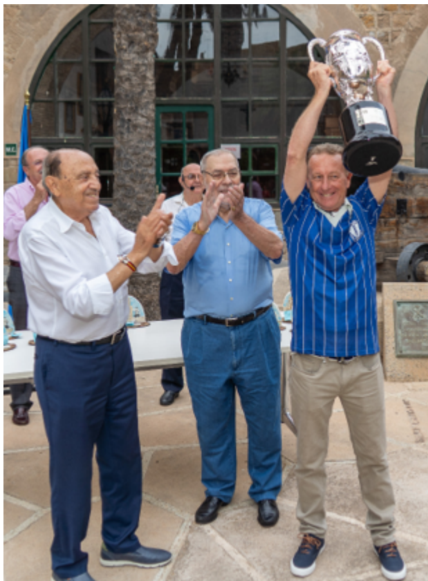
Mismos protagonistas, 40 años después.