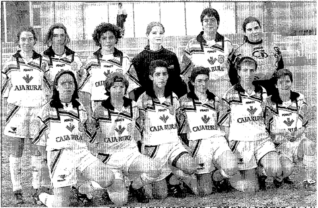
Las representantes zamoranas en 1999.

Avanzan los años 90 y la necesidad de jugar al fútbol sigue en muchas zamoranas. La prensa muestra casos como las fiestas de Benavente de 1994 en las que se jugó uno de los primeros partidos de fútbol femenino registrados en la villa, un "solteras contra casadas". En la capital y en otros pueblos como Barcial del Barco o Manganeses de la Polvorosa contaron con eventos similares. Con esos antecedentes se planteó recuperar el proyecto del Distrito 20, incluso ofreciéndolas un terreno de juego en Coreses, donde ya existía un femenino de fútbol sala, pero esos contactos no terminaron de cristalizar hasta 1997, cuando se organiza la primera liga autonómica. La Federación de Castilla y León tardó diez años en dar espacio a las mujeres desde su fundación. El Amigos del Duero comenzó a competir con una estabilidad mayor que la de su primera etapa. Durante sus primeras temporadas está en los primeros puestos de la clasificación de Regional, pero sin llegar a ascender.