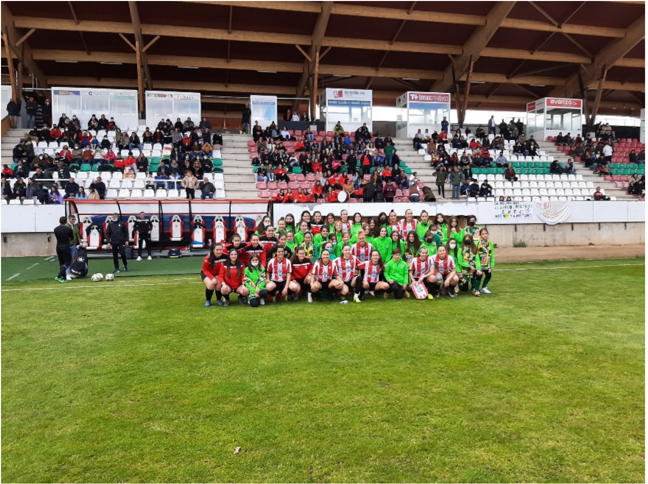
El Zamora FF en el Ruta de la Plata en 2022