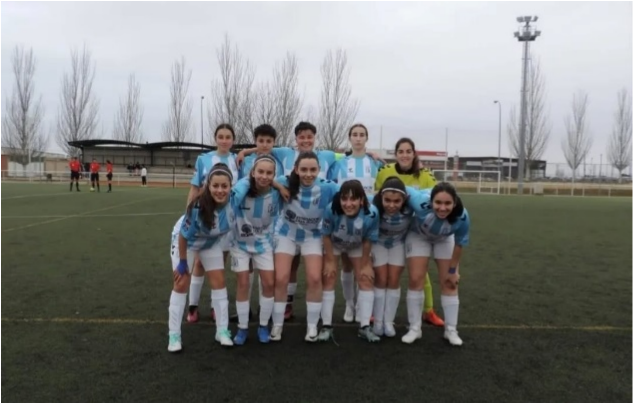
El Racing Benavente tras su choque como local ante el CD Ejido en la 23-24

Volviendo a la historia, tras el parón obligado por la pandemia de 2020 el panorama de la provincia cambió. Pese que habían existido intentos por crear clubes en el pasado, sobre todo en Benavente, será la modesta localidad de La Bóveda de Toro la primera en sacar este deporte de la capital. Este club pasará en tan solo dos años de la categoría más baja a nacional (la 2ª Regional-Doble G), convirtiéndose en el primer equipo de la provincia. En Benavente surgirá la sección femenina del Racing Benavente en 2023, ampliando el horizonte de esta disciplina en la provincia.