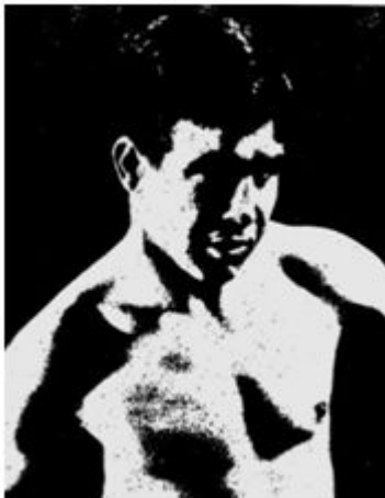
Boxeo (Peso Mosca)