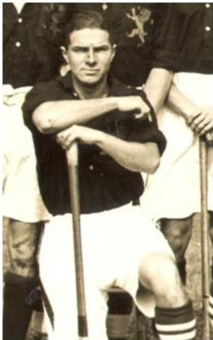
Hockey sobre hierba