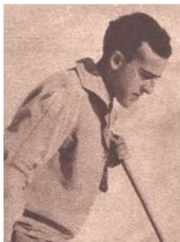
Esquí de fondo