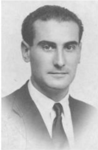
Hockey sobre hierba