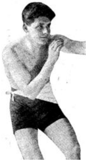
Atletismo (400 m.)

Olímpico y Abanderado de España en Amberes 1920