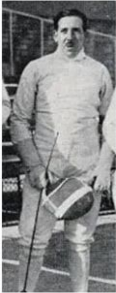
Esgrima (Florete, Espada)

Olímpico en París 1924 y en Ámsterdam 1928