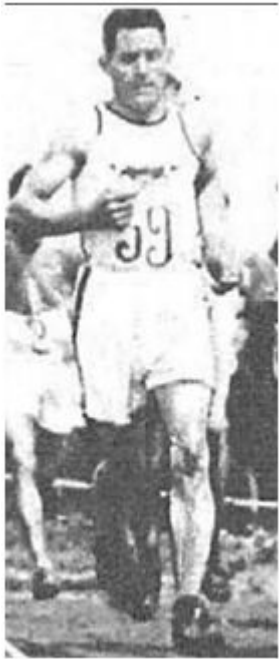
Atletismo (1.500 m., 5.000 m.)