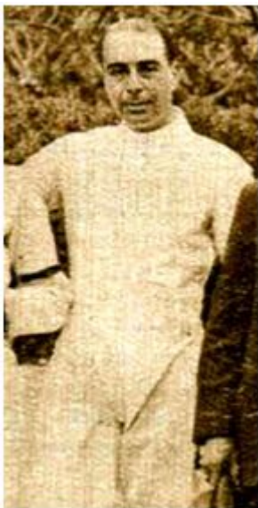
Esgrima (Espada, Sable)