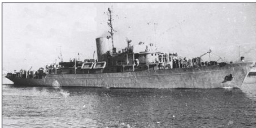
El "Vita", ya sin mástiles, convertido en nave patrullera, primero de la Armada estadounidense y luego de la israelí.

refriegas, y el número total de detenidos parece superó los 22.000. Prieto, político en ejercicio, intentó obtener por las armas lo que las urnas no le habían otorgado. Años después, asegurando haber aprendido la lección, hizo propósito de enmienda entre disculpas, comprometiéndose a no reincidir. Curiosamente, a lo largo de los últimos 30 ó 35 años, su figura muy denostada durante el franquismo ha experimentado un concienzudo lavado de cara, sin la aportación de un nuevo argumentario histórico. El péndulo, que diría un filósofo. Las olas vienen y van. Todo lo que sube, baja. Como la Historia, que tanto se repite. Como Indalecio Prieto, que adecuaba el discurso a la oportunidad de cada momento.