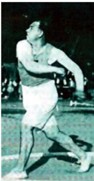
Atletismo (Lanzamiento de Disco)

Olímpico (inscrito, no llegó a competir) en Amberes 1920