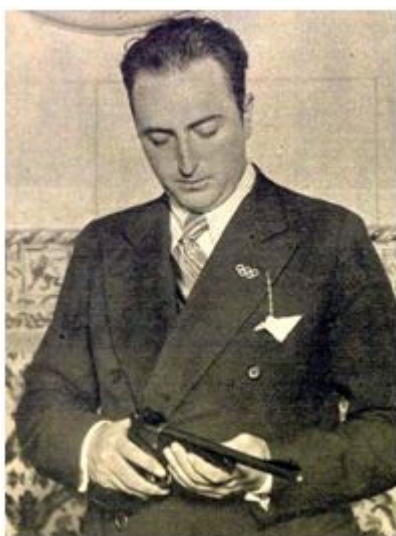
Tiro (Pistola, 25 m.)