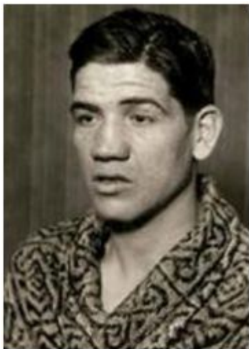
Boxeo (Peso Ligero)