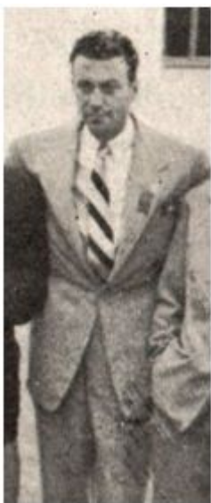
Hockey sobre hierba