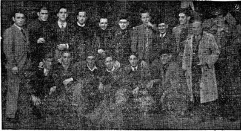
La expedición de los Campeones de Cataluña ayer, en la estación, dispuestos para el primer desplazamiento de Liga

...con el Español a Castellón y el Gerona al campo del Gimnástico valenciano