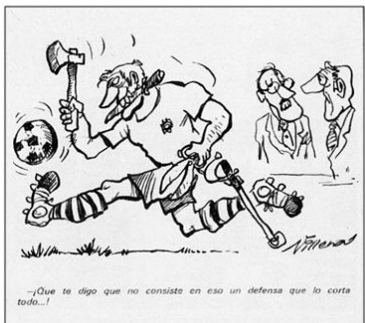
Sátira de Villena sobre los