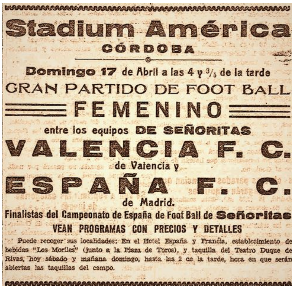
Figura 1. El anuncio del partido de football entre el Valencia F.C. y el España F.C. apareció publicado en La Voz los días 16 y 17 de abril de 1932. Biblioteca Virtual de Prensa Histórica.

Haciendo un pequeño inciso, el coliseo cordobés, inaugurado durante la Feria de Mayo de 1923, había vivido ya los célebres y reñidísimos partidos de rivalidad local entre el Córdoba Sporting Club y la Sociedad Deportiva Electromecánica F.C. de los años veinte, y atravesaba ahora por una nueva época protagonizada por su nuevo inquilino, el Córdoba Racing Club, origen de la indumentaria blanquiverde que con los años heredaría el actual Córdoba Club de Fútbol.