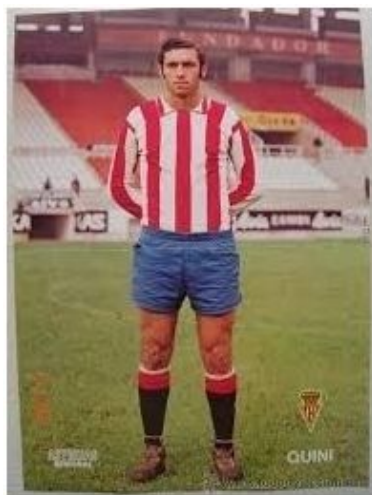
Enrique Castro "Quini"