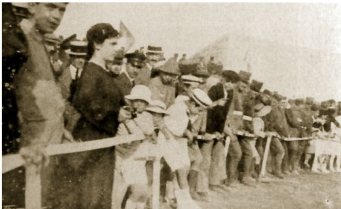
Foto: Aficionados durante un partido del Alfonso XIII en el campo Buenos Aires.

De este modo, el 5 de marzo de 1916 se fundaba el que hoy en día ha sido y es el club más importante de fútbol de las islas Baleares, el R.C.D. Mallorca.