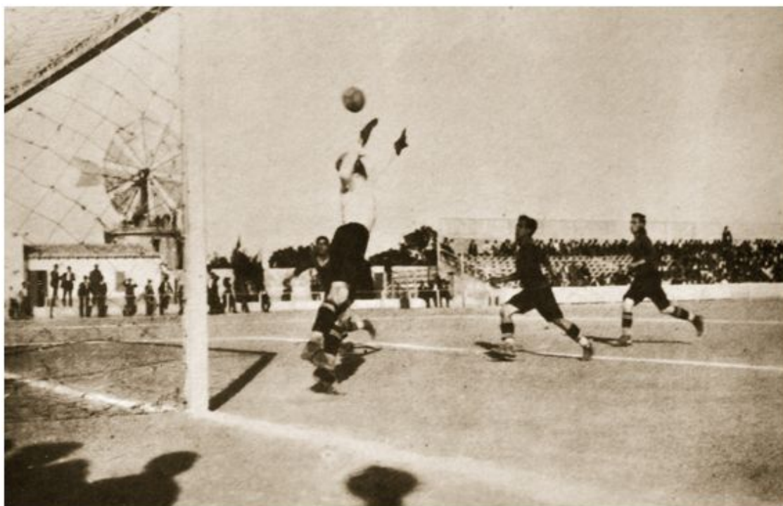
Foto: Partido disputado en el Buenos Aires durante los años veinte.

El diario La Almudaina describe en los días posteriores las características principales del estadio: «Tiene 96 m. de largo por 54 de ancho siendo más extenso que el del F.B.C. Barcelona» 1 . «El nuevo campo es hermoso y ayer tarde se apreciaron como nunca las excelentes condiciones de que esta dotado [...] Se han construido 28 palcos y el resto del terreno que rodea el campo de juego ha sido ocupado por sillas que permiten que un publico numerosísimo presencie el espectáculo» 2 .