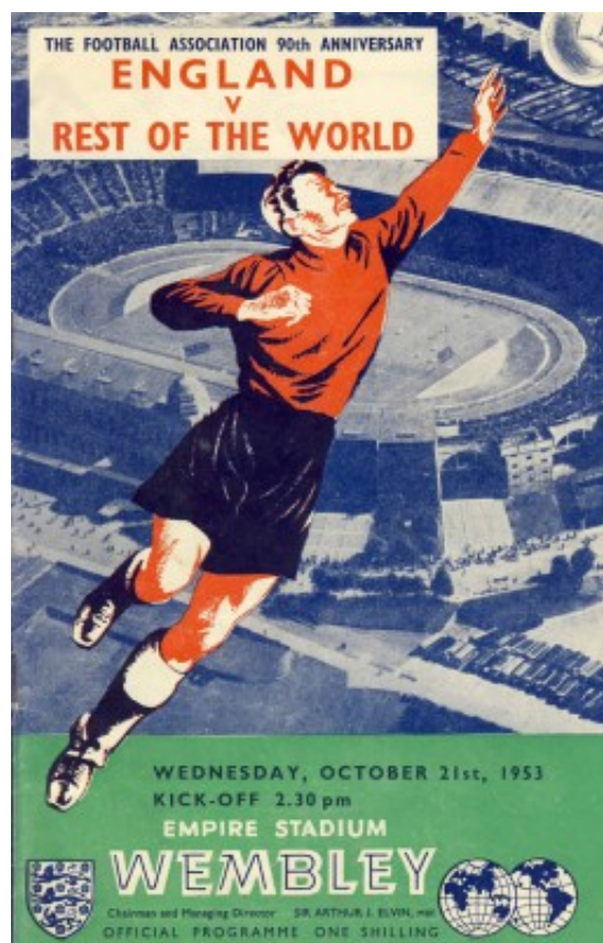
Imagen del programa oficial del Inglaterra-Rest of the World celebrado el 21 de octubre de 1953

futuro seleccionador inglés en el Mundial de 1966. En el combinado del Viejo Continente destacó László Kubala, autor de dos goles. El jugador del FC Barcelona estuvo acompañado por tres austríacos (Gerhard Hanappi, Walter Zeman y Ernst Ocwirk), tres yugoslavos (Zlatko Čajkovski, Bernard Vukas y Branko Zebek), un italiano (Giampiero Boniperti), un sueco (Gunnar Nordahl), un alemán de la RFA (Josef Posipal) y el futbolista del Real Madrid Joaquín Navarro, bautizado desde entonces como el 'Fifo'. Cabe recordar que Hungría no permitió la convocatoria de Ferenc Puskás i József Bozsik debido a la presencia de Kubala en el equipo. El duelo se jugó en el Empire Stadium, conocido popularmente como Wembley.