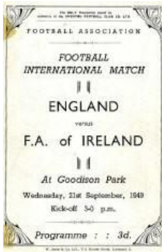
Imagen del programa oficial del partido.

Nueve de los once futbolistas irlandeses militaban en clubs ingleses. El capitán de aquel equipo, John Carey (también conocido como 'Jackie' o 'Johnny'), jugaba en el Manchester United e incluso fue designado 'Mejor jugador de la liga inglesa' en 1949.