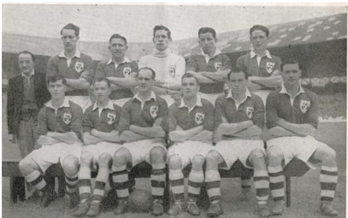
Imagen del histórico equipo de la FAI que rompió la imbatibilidad inglesa en 1949.

Desde entonces, la mayoría de libros que han repasado la historia de este deporte resaltan la exhibición húngara en Londres y recuerdan que los ingleses perdieron la imbatibilidad jugando como locales ante un rival extranjero. Es importante recalcar que los países que los ingleses bautizan como Home Countries (naciones que integran o han integrado la Gran Bretaña) ya habían ganado a Inglaterra en su campo. Aun así, la afirmación sobre el triunfo húngaro no es correcta: Irlanda había superado a los ingleses el 21 de septiembre de 1949 en un partido jugado en Goodison Park.